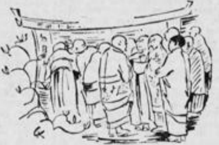
Zeichnung: Claire Krug

Der Kaiser nickte zustimmend, da er jetzt erkannte, daß der junge Sachver-