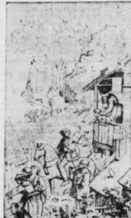
Illustration L. Richters zu dem Lied „Der Reiter am Tore“

Am 19. Juni 1884 ging das irdische Dasein Ludwig Richters zu Ende, schnell und ohne Schmerz und so still, so gesegnet, wie es sich ein Schaffender nur wünschen kann. Seine Illustrationen und Bildermappen hatten ihn in allen deutschen Häusern bekannt und beliebt gemacht, weit und breit wurde er als Freund empfunden.