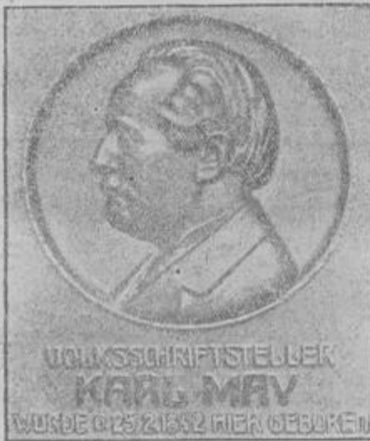
Der unbergeliche Karl May.

# Auch der Fußgänger hat ein Recht auf die Straße. Das Reichsgericht hat einen Freispruch eines preussischen Landgerichts zur neuen Behandlung zurückgewiesen, da der Spruch, der einen Motorradfahrer, der ein dreieinhalbjähriges Kind überfahren und dadurch getötet hatte, von fahrlässiger Tötung freisprach, dem Reichsgericht zu weit ging. Der Motorradfahrer hatte geltend gemacht, daß er wegen Unübersichtlichkeit der Straße das Kind zu spät gesehen hätte. Das Reichsgericht stellte sich auf den Standpunkt, daß der Freispruch vom Kraftfahrer viel zu wenig und vom Fußgänger, der mit dem gleichen Rechte den Weg benützte, zu viel verlangte. Der Kraftfahrer dürfe nur so schnell fahren, als es den Umständen entspreche und daß er jederzeit zum Halten in der Lage ist.