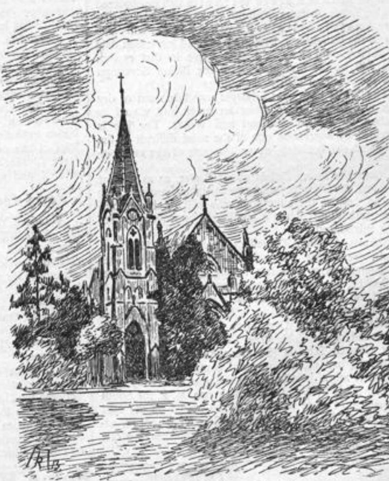
Drawn for the „Wiesbadener Badeblatt“ by our „A. F.“-correspondent.