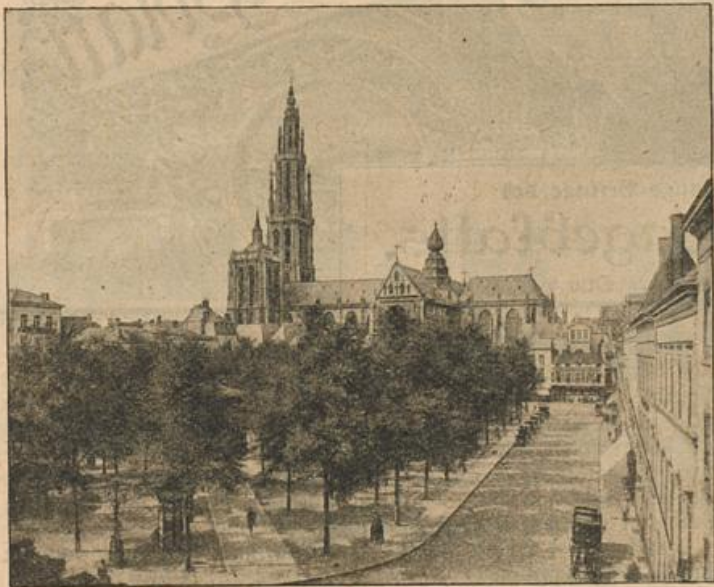
Die Kathedrale von Antwerpen. (Mit Text.)

„Wat? Wie heißt dat? Marsch retour?! Jawoll! Marsch retour, ihr Schinnäster da hinten! Marsch retour!“