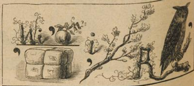
Auflösung folgt in nächster Nummer.