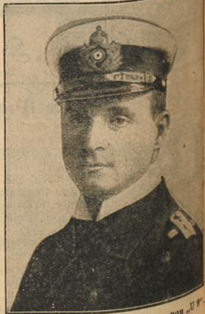
Kapitänleutnant Otto Weddingen von „U.“ (Mit Text.)

Ein Dorf — eine Menschenheimat . . . in Flammen . . . o Gott . . . wie furchtbar der Krieg. Noch nichts vom Feind zu sehen — natürlich, wir haben ja Deckung hinter dem Dorf.