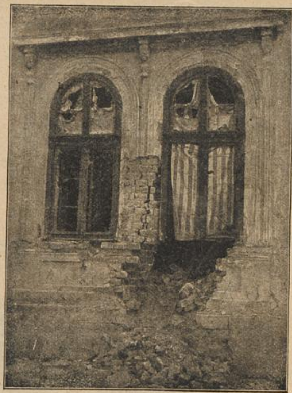
Das serbische Generalstabsgebäude in Belgrad nach der Beschießung durch die österr.-ungar. Armeen.

„In der Mitte der Front der Bataillone auswichen sich, von ihren Wachs- bändern befreit, die Fahnen im lauen Nachmittagswinde, die und silbernen Fahnenbänder flatterten, ruhmreiche Reihen des ersten, heißen Tages, an dem die Banner vor zum ersten Male zum Siege geführt — bei König- wer gedachte da nicht des feierlichen Tages, da er sie ersten Male entrollt gesehen in der Garnisonkirche in Han- galt es, unverbrüchlich zu wahren die gelobte Treue.“