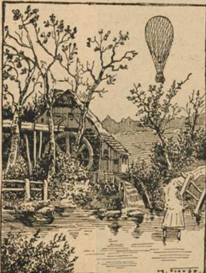
Wo ist der Luftschiffer?