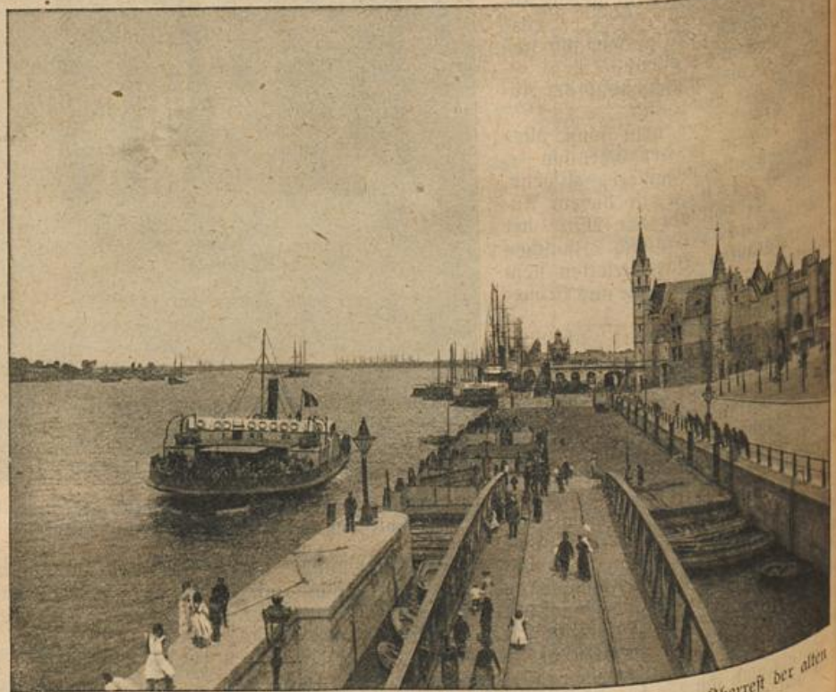
Der Hafen von Antwerpen: Rechts das Altertumsmuseum „Het Steen“, der Oberrest der alten Burg von Antwerpen. (Mit Text.)