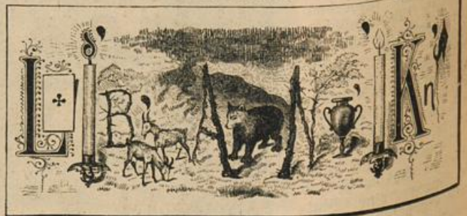
Auflösung folgt in nächster Nummer.