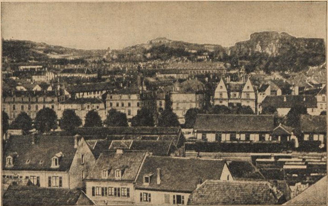
Die französische Festung Belfort. (Mit Text.)

Da war es, als fühle er seinen Blick — sie hob ihre Augen; eine Blut- rote ergoß sich über ihr Gesicht; unwillkürlich antwortete sie auf und stand vor ihm. „Ich möchte mich ver- abschieden, Fräulein Odenberg, und möchte Ihnen zugleich dan- ken, daß Sie sich meiner Mutter so gütig und aufopfernd an- genommen haben!“ Sein förmlicher Ton erkältete sie bis ins Innerste. Sie nahm