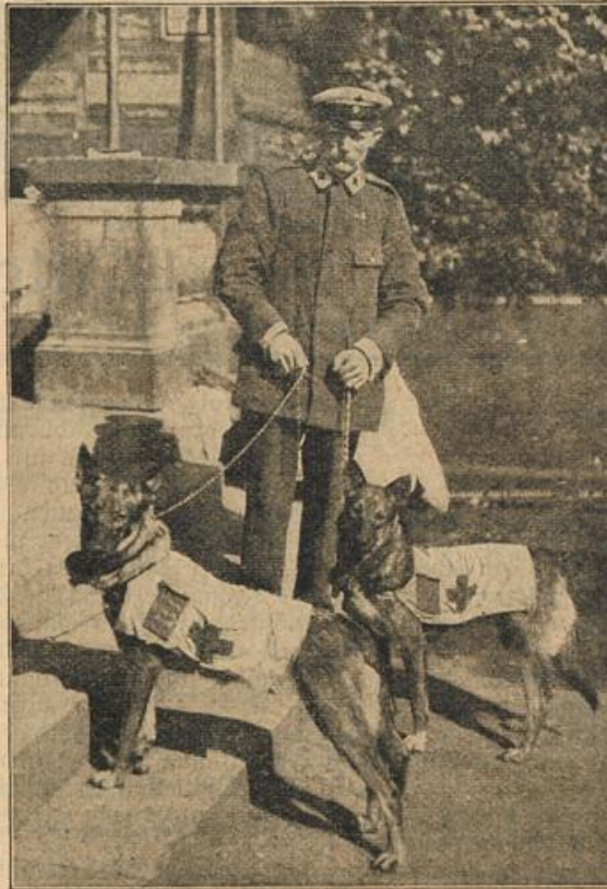
Kriegs-sanitätshunde. (Mit Text.)