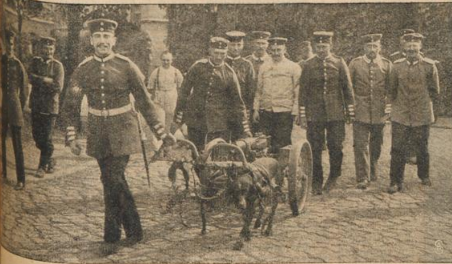
Erprobtes belgisches Maschinengewehr mit Hundebespannung.

drängten, und unter irgendeinem Vorwand verließ sie Zimmer. Im Garten, ganz in der Ecke am Zaun, wo die alten Flieder- stände waren, stand ein kleines, kunstlos gezimmertes Bänkchen, das Bernhard als Schüler selbst verfertigt hatte, um dort un- ter sich zu setzen. Der Platz war auch ihr Lieblingsplatz geworden; sie suchte sich dort auf; dort würde sie niemand stören. Sie mußte allein sein wegen des Schmerzes. Bernhard ging — und niemals würde sie ihn wiedersehen — er hatte nicht vergessen; er war voller Groll! Aber ihr ganzes Herz, ihre ganze Seele verlangten nach ihm — wie sollte sie nur ein Leben ohne ihn ertragen! Als sie sich setzte, hatte vor sich stehen sehen, war es ihr deutlich wie nie vorher Bewußtsein gekommen — ihn liebte sie mit all der Kraft einer Leidenschaft, deren sie fähig war — und er? So fremd und unbekannt sprach er mit ihr, wie wohl nicht mit dem geringsten seiner Gefühl. Für ihn war alles vorbei! Und die ganz leise auf- kommende Hoffnung, er würde vielleicht vergessen vergeben, starb lang- sam in ihrem Herzen. — In ihrer Verjüngung hatte sie ganz das Gedächtnis von Schritten verloren. Es war Bern- hard Wagner, der näher- hin Dicht neben den Bäumen blieb er war seiner noch gewahr geworden. Er wollte sich verabschie- den, er hatte sie schon im Garten gesucht. „Lass sie nun — auf sei- ner Nacht!“ Mit Rührung schaute er sie. Wie blaß sah sie aus — so ernst und bedrückend!