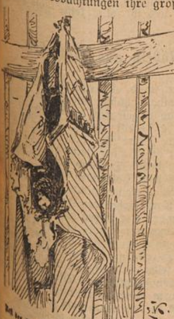
Worm des Bauern in einer Arbeiterhose.

Hopfschüttelnd wird mancher Ackermann oder Gärtner diese Überschrift lesen, denn allgemein erkennt der Landwirt er, die Regenwürmer als ein schädliches Geschöpf an, dem auch aus diesem Grunde noch bei vielen Bauern in diesem Range mit dem Maulwurf; man betrachtet sie als Feinde der Landwirtschaft, obgleich man ihnen nichts Böses anmerken kann. Der verständige, aufgeklärte Landwirt weiß, daß ihm der Maulwurf keinen Schaden zufügt; dasselbe gilt vom Regenwurm. Der Regenwurm ist danach nicht nur nicht schädlich, sondern er ist für unsere Bodenkultur sogar höchst nützlich, fast unentbehrlich. Darwin hat durch jahrelange Beobachtungen ihre große Rolle, welche sie bei der