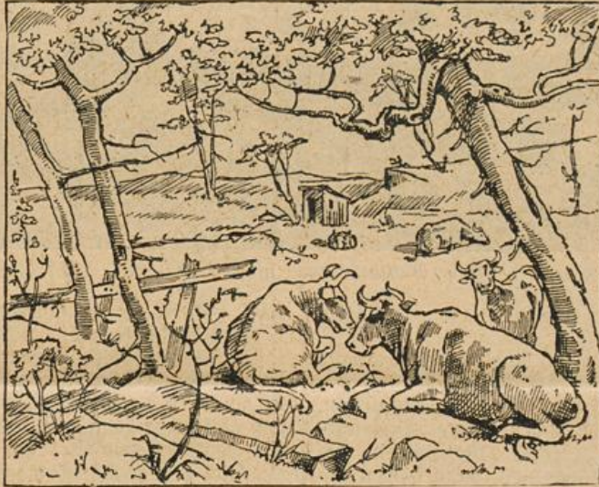
Wo ist der Stenom?

ganz vorzüglich zur Haltung in Gewächshäusern. Sie haben hier eine größere Freiheit als im Käfig oder in der Vogelstube und machen sich durch Vertilgung von Ungeziefer sehr nützlich. Natürlich ist ihnen daneben auch noch Futter zu geben.