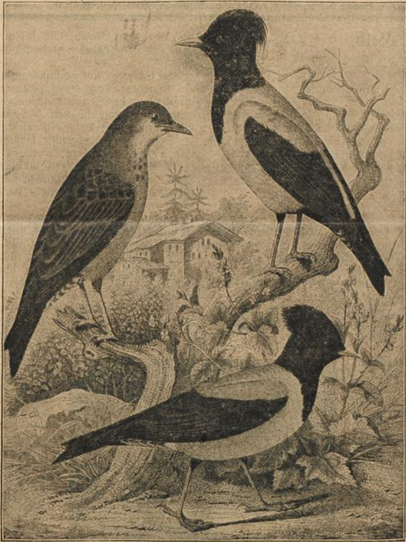
Der Kojenstär. (Mit Text.)