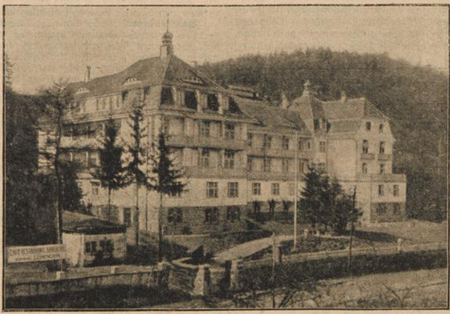
Das neue bayerische Militärkrankenhaus in Bad Kissingen. (Mit Text.)

Er hatte Geld. Überreichliche Mittel standen ihm zu Gebote, und das Geld ist das moderne Zaubermittel, das alle Türen öffnet und alle Hindernisse sprengt. Ein ganzes Heer von Helfern wollte er aufbieten und an- werben, die in seinem Dienst sich allein be- schäftigten.