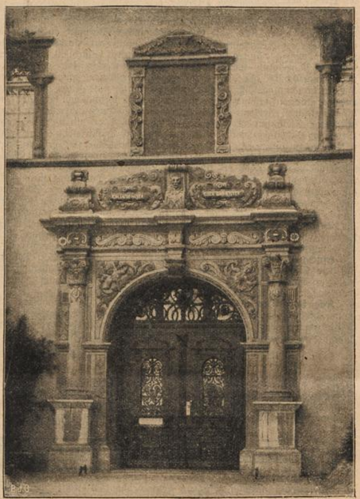
Das Portal am Rathaus zu Schaffhausen. (Mit Text.)

Null. Unter den Millionen verlor sich Karlas Spur. Wohin sich wenden? Welche Richtung einschlagen? Karla befaß hier Verwandte und Bekannte. Borchd fuhr in kürzestem Tempo von einem zum andern. Er gönnte sich nicht eine Minute Ruhe. Telephon und Telegraph ließ er spielen nach allen Orten, wo Karla gesehen sein konnte. Als es Abend wurde, befaß er noch nicht den geringsten Anhalt. Auch der nächste Tag verlief ihm in der gleichen Weise. Enttäuscht, bis zum Umfallen müde und des Schlafes dringend