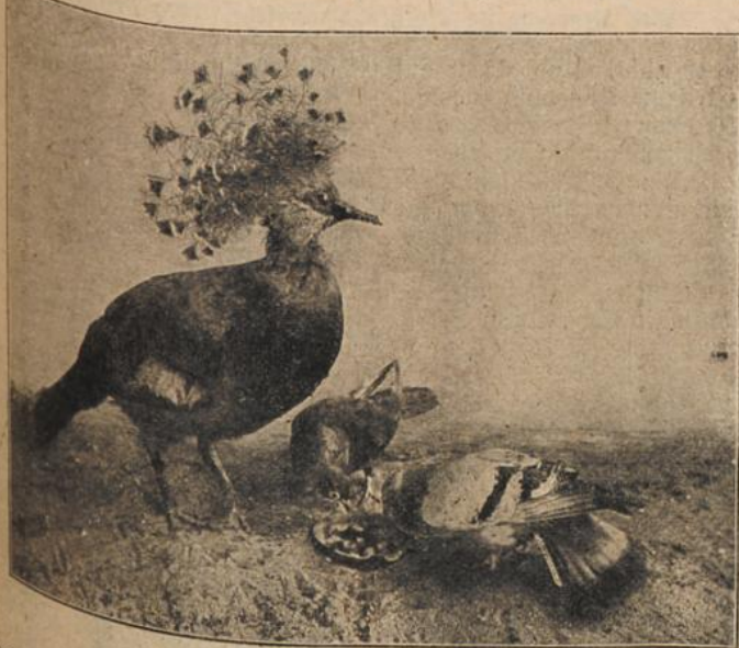
Eine Niesentaube. (Mit Text.)

Aber in Wesen und Sprache hatte er nichts Affektiertes. „Hat meine Braut von mir gesprochen, Herr Doktor?“ fragte von der Borch. „Allerdings, das hat sie, Herr Rittmeister.“ „So wird es nicht schwer halten, sie schonend und langsam darauf vorzubereiten, daß ich hier bin. Würden Sie das über- nehmen können?“ „Nicht so stürmisch, Herr Rittmeister. Ihre Braut ist noch krank. Sie haben mir in einer früheren Unterredung auf meine Bitte die Vorgeschichte der Krankheit enthüllt, wie sich dem Arzte gegenüber, wenn er mit Erfolg wirken soll, nur die rück- haltloseste Offenheit geziemt. Unter dem Druck dieser Vergangen-