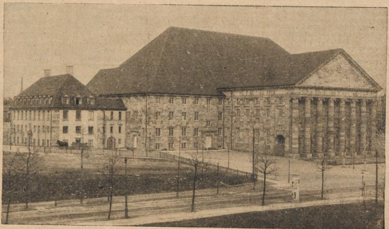
Die neue Stadthalle in Kassel. (Mit Text.)

„Auf Wiedersehen!" erwiderte Gerda und zog ihre Hand zurück. Der Zug fuhr noch nicht gleich davon, aber Heller hielt sich