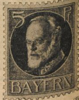
Die neuen bairischen Briefmarken.