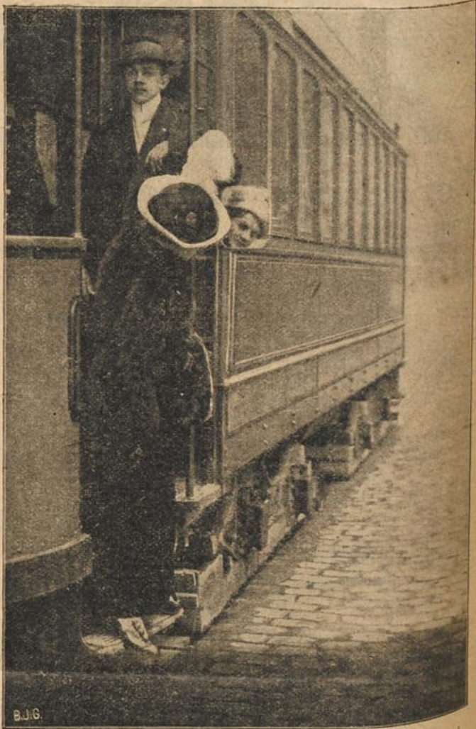
Eine Neuerung im Straßenbahnverkehr. (Mit Text.)

Heller hat's nötig. Ist das nicht sehr nett. Gratuliere zu dem stehliche!"