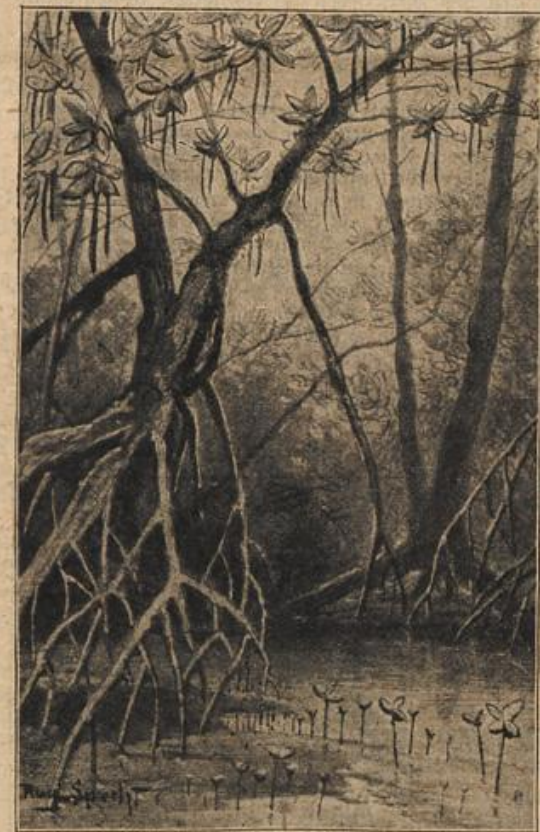
Eine lebendiggebärende Pflanze. (Mit Text.)

heut' lieb' ich die Johanne und morgen die Susanne — das nennt ihr Liebe. Liebe ist etwas Schweres, furchtbar Starkes. Liebe ist opferfähig und hat Freude am Opfer. Du kennst das nicht. Es hat noch nicht dein ganzes Wesen gepackt. Nur kleine Strohfeuerchen flackerten bei dir auf, vielleicht reichlich oft — jetzt zum Beispiel wirst du der Schneepinzessin die Nur schneiden.“