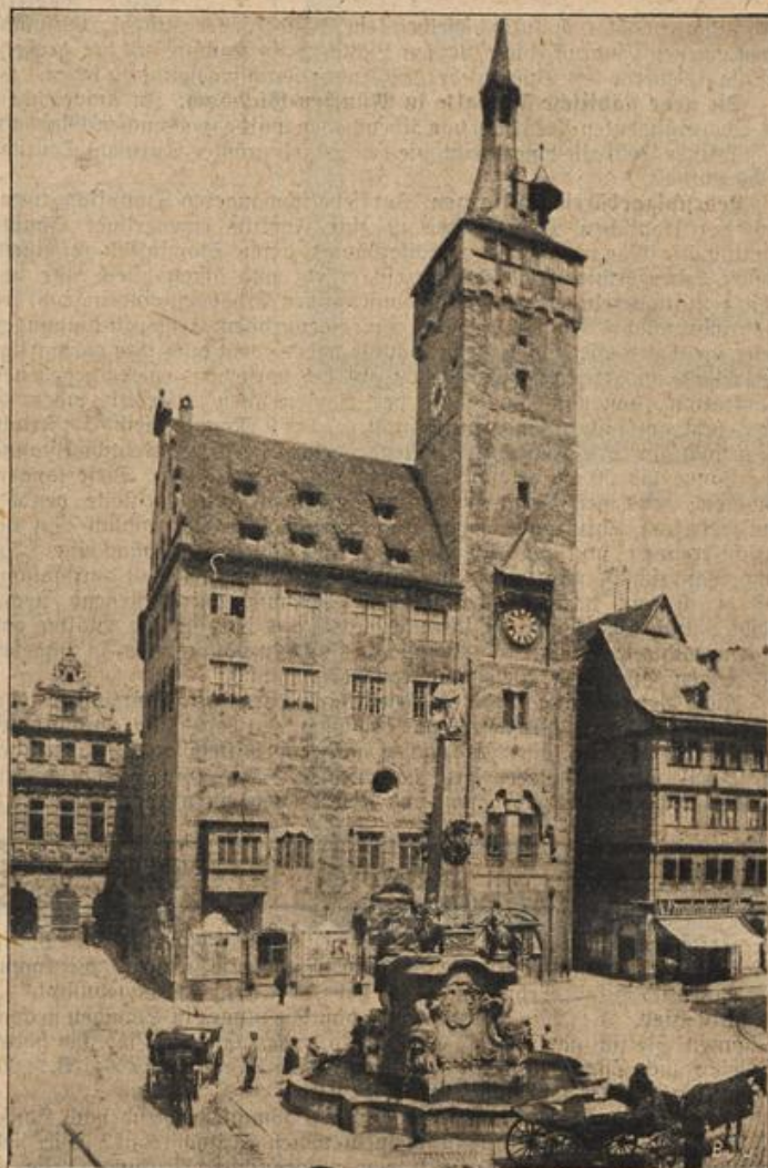
Zur Renovierung des Grafen-Caard-Turm in Würzburg. (Mit Text.)