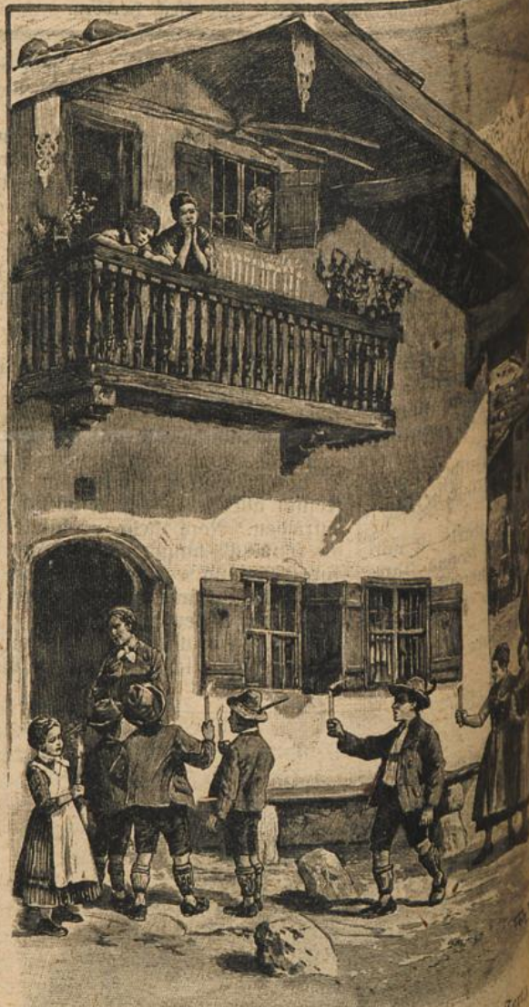
Die Pfingstlichteln in Berchtesgaden. (Mit Text nach Skizzen von F. Kenter gezeichnet von F. Kenter)

Die jungen Männer grüßten, als die Schöne vorüber kam.