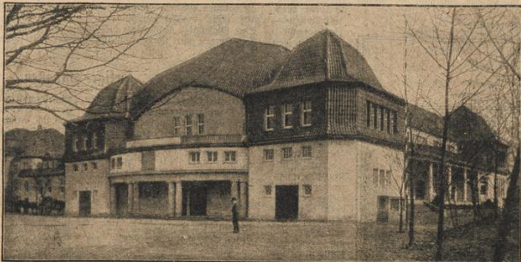
Die neue städtische Festhalle in München-Gladbach. (Mit Text.)

erscheint auch das Pfingstfest. Die Zeit, um welche der Lenz in seine vollste Pracht eintritt, mag wohl bei unseren germanischen Vorfahren im grauen Heidentume noch eine viel dringendere Veranlassung zu festlicher Stimmung gewesen sein als heutzutage. Jene Festlichkeiten, welche da, wo sich noch alter Brauch im Volke erhalten hat, um Pfingsten gefeiert werden, lassen deutlich erkennen, wie in manchen Gegenden rätselhaft heidnische Überlieferung, anderwärts dagegen christliche Anschauungen den Grundzug der Festveranstaltungen bilden. Man wird solche Sitten immer am lebendigsten in rein ländlichen Gegenden finden, wo noch nicht die Aufklärung und die modernen Interessen einer industriellen Bevölkerung das Althergebrachte weggewischt haben. So ist es insbesondere in den verschiedenen Landbezirken Altbayerns der Fall. In den Ortschaften der zur Donau