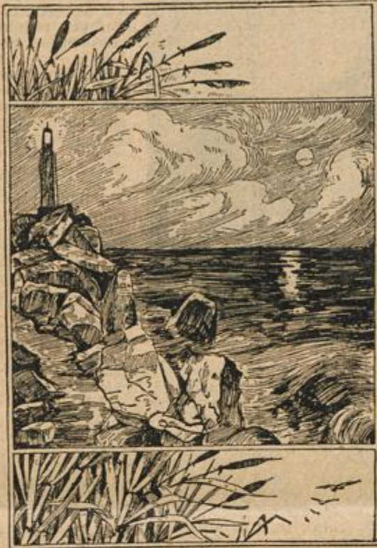
Wo ist der Leuchtturmwärter?

auch zu sorgen hat, daß durch dieselben kein Schadenfeuer entsteht. Es macht einen eigenen Eindruck, diese kleinen Lichtchen im Kampfe mit der großen, auf die Felsberge des Tales niederstrahlenden Frühlingssonne zu sehen.