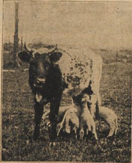
Eine seltsame Pflegemutter. (Mit Text.)

Alle die Stunden zogen noch einmal an seinem Geiste vorüber, in denen er Karlas beglückende Gegenwart genossen hatte. Die Erinnerungen umwehten ihn wie schmeichelnde Lüfte, und was ihm in der Zukunft durch ihre Liebe geschenkt wurde, das malte er sich in den glühendsten Farben aus.