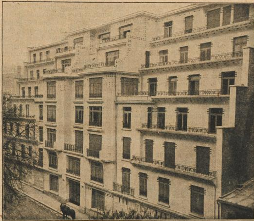
Eine neue Art von Wohnhäusern in Paris. (Mit Text.)

„Sein Intimus, Herr Oberst? Nein, da sind Herr Oberst