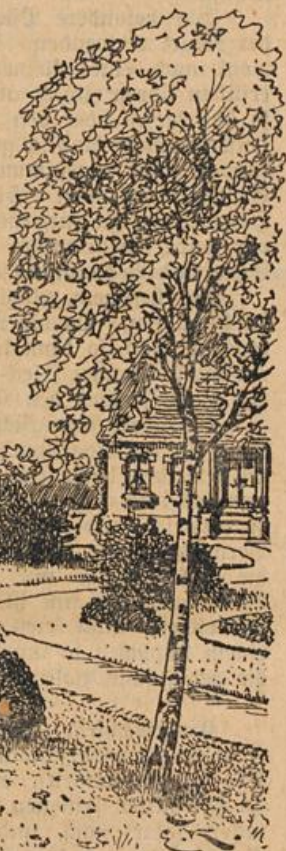
Einfacher Ziergarten einer ländlichen Villa.

Zur Beseitigung der Steine aus den Aekern. Um nun diese Stellen, zumal im Frühjahr herauszufinden, sei darauf aufmerksam gemacht, daß der Acker nach großen Regengüssen stets dort zuerst abtrocknet, wo in der Nähe der Erdoberfläche Steine liegen, selbst Steine, die über einen Fuß tief liegen machen sich an der Erdoberfläche bemerkbar, können aber leicht entfernt werden.