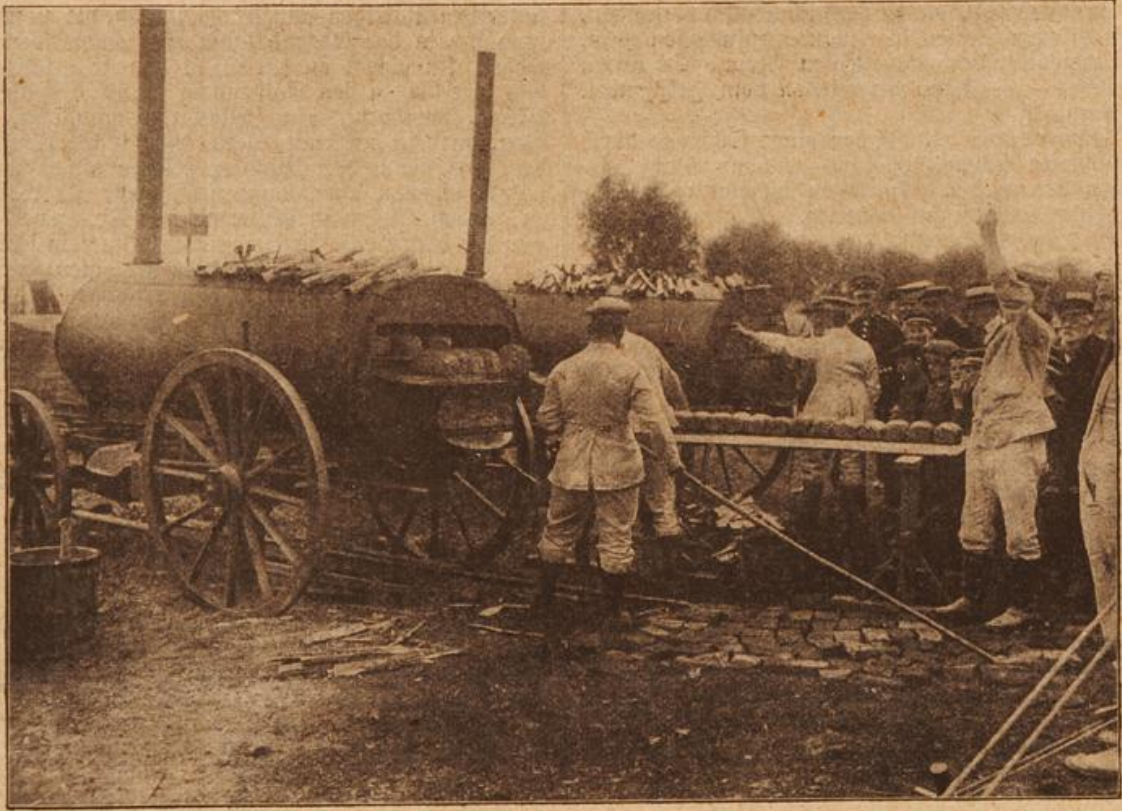
Verpflegung und Ausrüstung des Millionenheeres: Badöfen. (Mit Text.)

„Der wagt es wirklich, bei anständigen Leuten Besuch