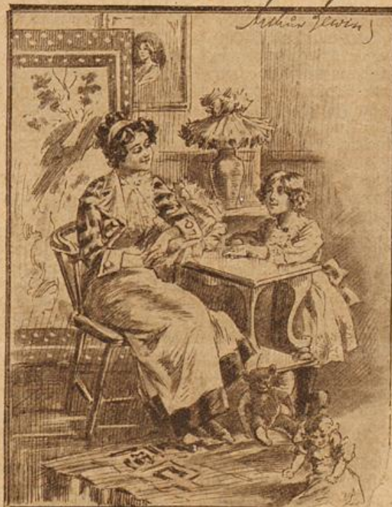
Gesichtspunkte. Die kleine Trude: „Mama, Onkel Rechtsanwält sprach gestern immer von Gesichtspunkten, melnte er da Tantes Sommerprossen?“

Ein gepanzertes französisches Flugzeug , ausgerüstet mit einem Geschütz zur Vernichtung gegnerischer Flugzeuge und zur Jagd auf Luftschiffe. Mit diesem Flugzeuge wurden kurz vor dem Ausbruche des Krieges in Villacoublay bei Paris Versuche gemacht. Von Erfolgen dieser Panzerflugzeuge hat man aber bisher ebensowenig gehört, als von der Fliegerinvasion, durch die am ersten Kriegstag die Rheinbrücken und die Hauptversorgungsstellen zerstört werden sollten.