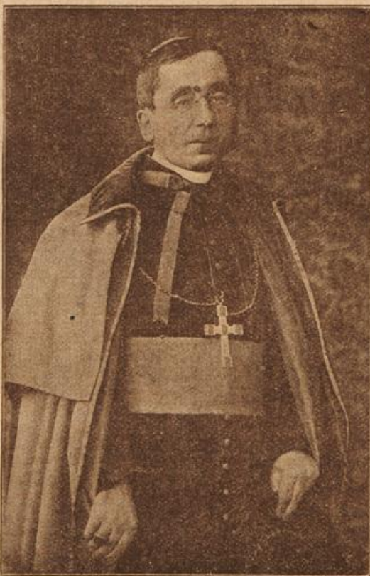
Papst Benedikt XV., Kardinal della Chiesa. (Mit Text.)

Dann aber erwachte in ihr die Künstlernatur. Was lange geschlummert hatte, das wurde plötzlich wach und drängte hervor mit Allgewalt, mit genialer Kraft. Zu eng wurden ihr die kleinlichen Verhältnisse der Heimat, zu leidenschaftlich pulste ihr Blut. Hinaus mußte sie! Hinaus in die Welt! Um das zu werden, wonach ihre Phantasie schmachtete. Und nichts mehr hielt sie zurück in dem kleinen Ort, in dem ihre Künstlerseele zu verkommen drohte.