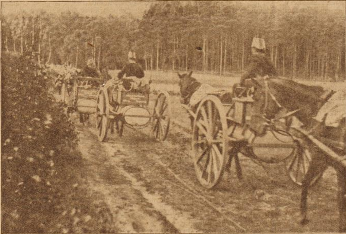
Verpflegung und Ausrüstung des Millionenheeres: Wasserwagen. (Mit Text.)

Als er dann weiter ging, sah er an einer der Anschlagssäulen ein großes Plakat in grellen Farben und Lettern leuchten. Und da kam neues Leben in ihn. Sein Gesicht bekam Farbe, seine Hände spielten nervös mit dem Stock, und ein leises Zittern ging