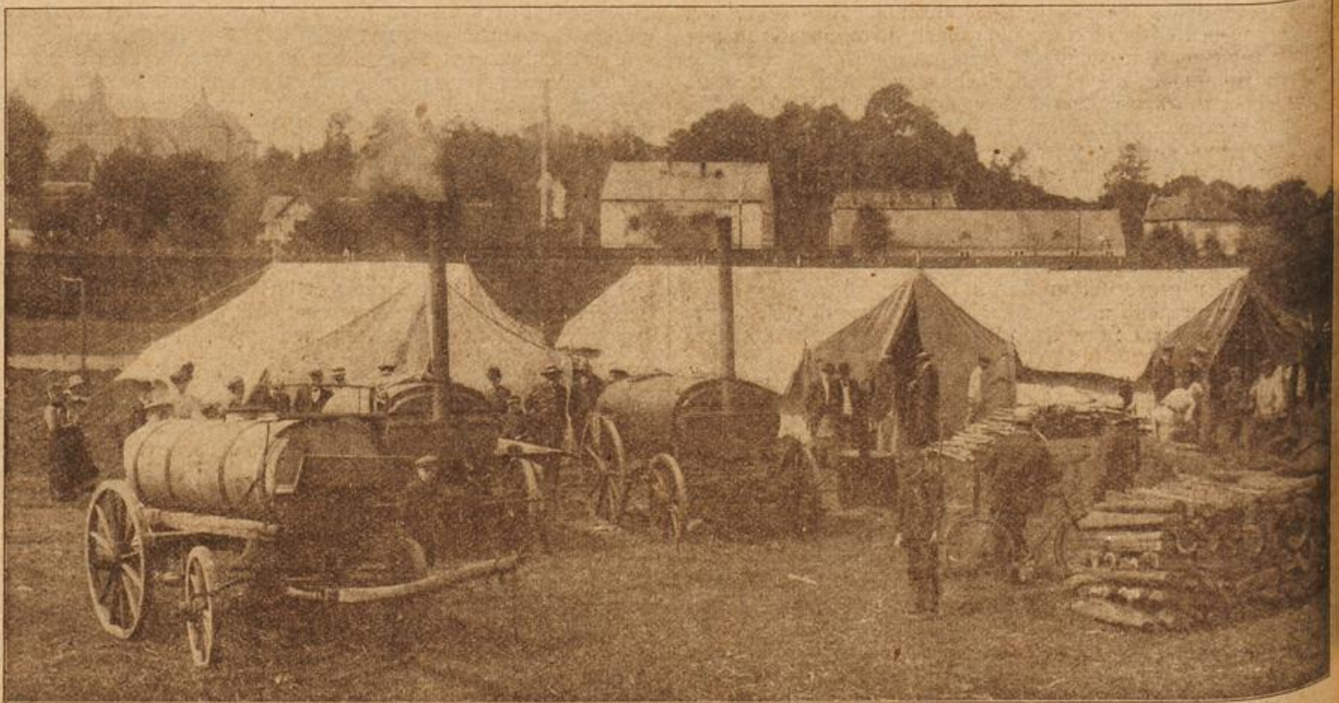
Verpflegung und Ausrüstung des Millionenheeres: Feldbäderci. (Mit Text.)

Er schlenderte langsam weiter. — Als das bunte Treiben, das lebhaftes Gewoge um ihn herum fesselte seinen Blick, er sah das alles mit staunenden Augen an, denn es erschien ihm wie eine Welt, der er Jahrzehnte lang entrückt gewesen, er kam sich vor als wäre ein verträumter, lebensmüder Greis, den man plötzlich in ein ihm völlig fremdes Stückchen Welt hineingelegt hatte und nun unsicher und haltlos sich weiter tasten