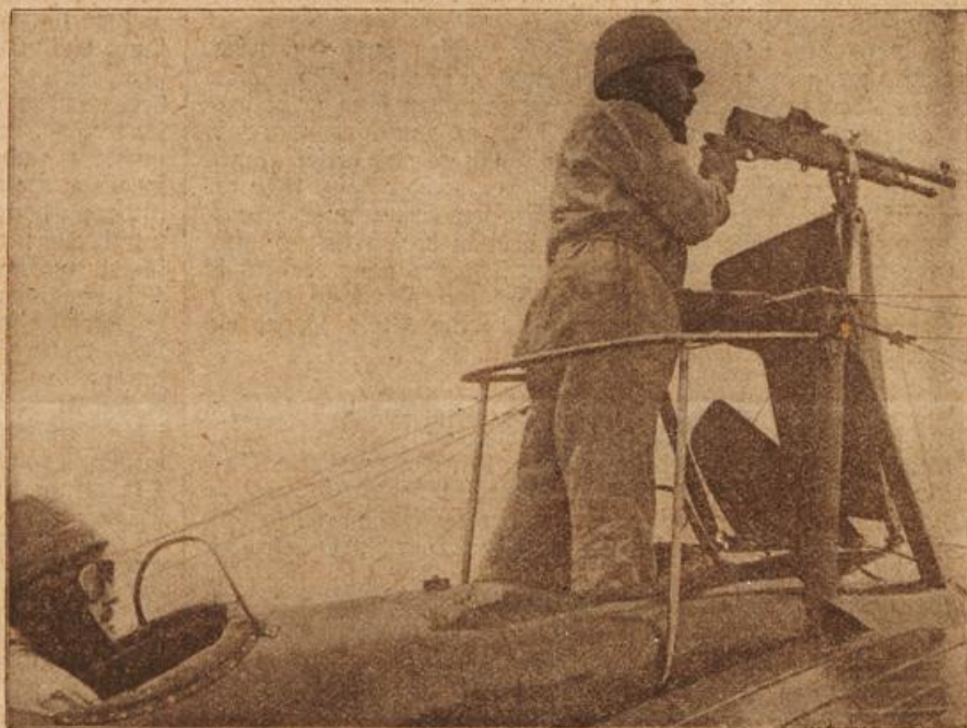
Ein gepanzertes französisches Flugzeug. (Mit Text.)