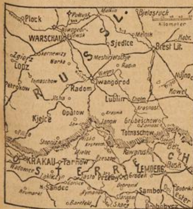
Karte vom Kriegsschauplatz in Polen.

Auf dem südöstlichen Kriegsschauplatz haben sich die Verhältnisse seit gestern nicht geändert.