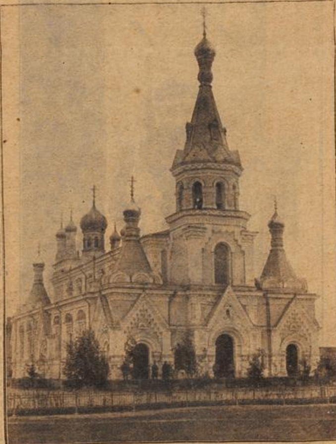
Die Kirche in Suwalki.

So schallt es voll Begeisterung aus den Kehlen der stolzen Vaterlandsverteidiger, die heute das ostpreussische Heimatdorf verlassen, um freudig des Kaisers Ruf zur Fahne zu folgen. Alles, was laufen kann, begleitet sie zum nahen Bahnhof: alt und jung, groß und klein, vornehm und gering. O, was ist aus diesen sonst so wenig beachteten schlichten Bauersleuten, Tagelöhnern und Gutsknechten heute auf einmal geworden! — Soldaten — Krieger.