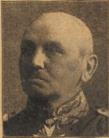
Generaloberst von Klud.

Die zarte Mutter, die der Vater sich aus der Fremde geholt und die nie recht Wurzeln fassen konnte in der melancholisch-schönen Einsamkeit des entlegenen Tales, des ausgedehnten Gehöftes, die aber trotzdem mit Selbstverleugnung den Ihren soviel Sonnenschein gab, so vieles war, durch die sanfte Güte, und tiefe Innerlichkeit ihres Gemütes, starb früh. Und es war, als hielten ihre Hände noch über den Tod hinaus die Seele dessen, den sie so sehr geliebt, mit dem sie solch trautes Eheglück genossen. Der Vater konnte den Verlust des teuren Weibes nicht vergessen. Stets zum Grübeln geneigt, verentte er sich nun ganz in seinen Schmerz, seine Trauer. Wortfarg und unnahbar überwachte er die Arbeiten, die die Mühle und seines Hofes Acker und Wälder und Wiesen erforderten, düster und in sich gefehrt verbrachte er seine Ruhestunden in seines Zimmers Einsamkeit über nachdenklichen Büchern. Die beiden älteren Vuben besuchten in der Hauptstadt das Gymnasium, den Jüngsten, Erik, erzog Karin, des Vaters Schwester, während der Pfarrer des nächsten Kirchsprengels dem Knaben aus seinem Wissen das dazu tat, was ihm die einfache Landschule nicht geben konnte.