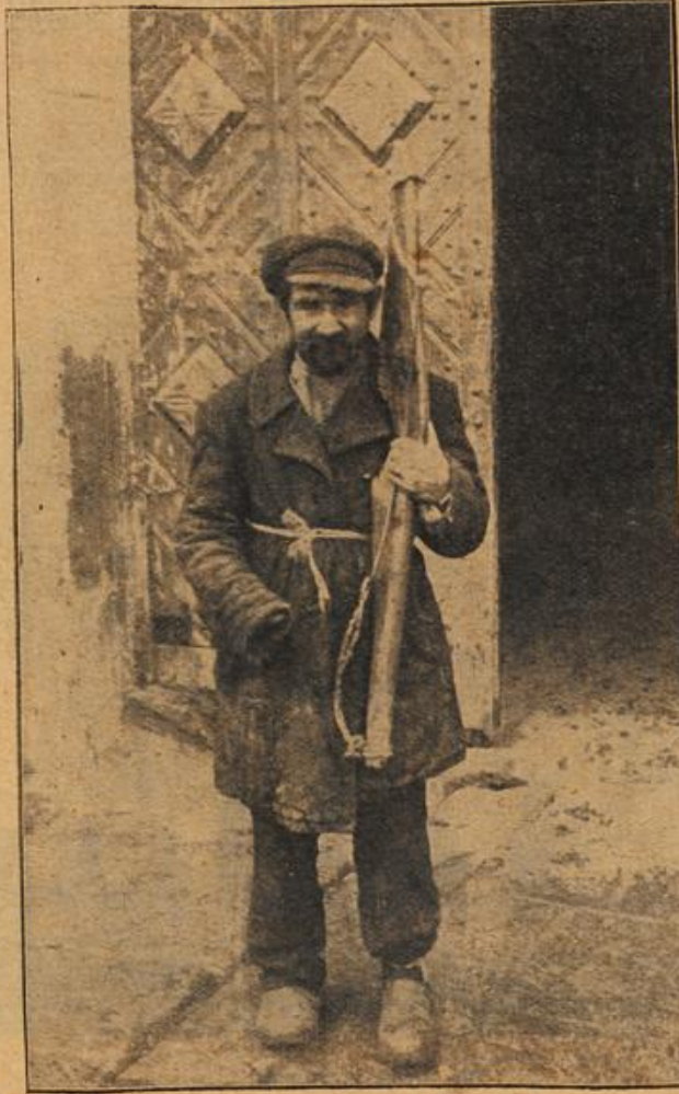
Typische Gestalt aus dem Volk in Suwali.

Die Schrotgeschosse haben das Dach der Hütte vernichtet.