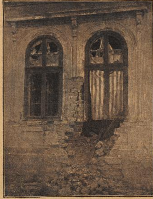
Das serbische Generallabsgebäude in Belgrad nach der Beschädigung durch die österreichisch-ungarische Armee.

zu verzeichnen hat. In weitem Abstand folgt an zweiter Stelle Wien mit 603 Kon- zerten, dann schließen sich an München mit 418, Hamburg mit 351, Dresden mit 309, Leipzig mit 295, Frankfurt mit 212 (gegen 112 im Vorjahre), Breslau mit 183, Prag mit 160, Stuttgart mit 122, Karlsruhe mit 83 Konzerten. Es ist überflüssig hinzu- zusetzen, daß diese Zahlen mehr für die gewerbliche Steigerung des Agentur- betriebes als etwa für die künstlerische Reg- samkeit der einzelnen Städte bezeichnend sind. Ist es doch allgemein bekannt, daß das Publikum namentlich den Solisten- konzerten fast teilnahmslos gegenübersteht und daß die Durchschnittsqualität dieser Veranstaltungen — zum Schaden der wirklich leistungsfähigen Künstler — das geringe Interesse der Öffentlichkeit durch- aus rechtfertigt. Indessen scheint die Zahl derer, die sich zum Konzertpodium drängen, trotz aller Warnungen und Einsprüche im- mer noch anzuwachsen, so daß vorläufig noch keine Aussicht auf eine Verminderung des Künstlerproletariats vorhanden ist.