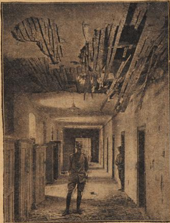
Ein Anbau des serbischen Königspalastes in Belgrad nach der Beschädigung der Hauptstadt von Semlin aus.

Die Fingerabdrücke auf der Speisefarte. Szene: Ein großes Speiselokal „Futter- zeit“ nach einem vor dem Lokal hängenden Plakat von 12 bis 4 Uhr. Es dürfte etwa halb 4 Uhr sein. Ein verspäteter Gast stürzt herein, entledigt sich seines Ueberrocks und nimmt Platz. Der Ober tritt auf: „Pilsner oder Münchner?“ Der Gast, sichtlich ent- rüstet: „Erst die Speisefarte!“ Der Ober bringt die Karte. Man sieht ihr an, daß sie heute schon durch viele Hände gegangen ist.