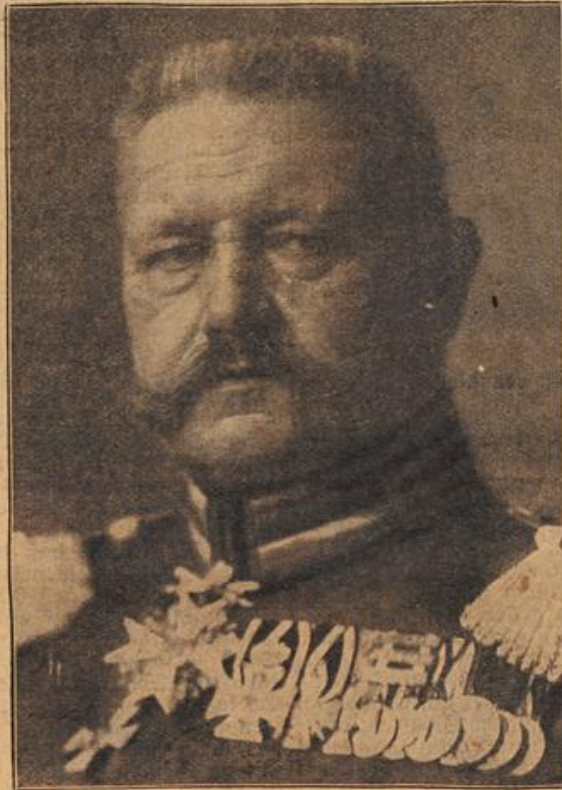
Generaloberst von Hindenburg, der heldenreiche Führer unserer Dämonen.

Ohne daß ein Wort darüber zwischen ihnen gewechselt wurde, feierten ihre Seelen Versöhnung, waren wieder eins, schlossen sich enger und zärtlicher einander an, ganz durchdrungen von der still und friedevoll machenden Erkenntnis, daß ihnen bestimmt war, sich zu finden in der Liebe, die das wunderbarste und geheimnis-