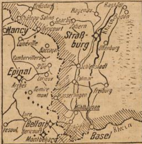
Das Schlachtfeld bei Mülhausen.

Der glänzende Erfolg bei Mülhausen tritt der Erstürmung von Lüttich würdig an die Seite. Noch ist unsere Mobilmachung nicht vollzogen, und bereits ist eine feindliche starke Festung in unsere Hände und eine feindliche Armee von 50 000 Mann hat ihre besetzte Stellung in offener Feldschlacht unter großen Verlusten räumen