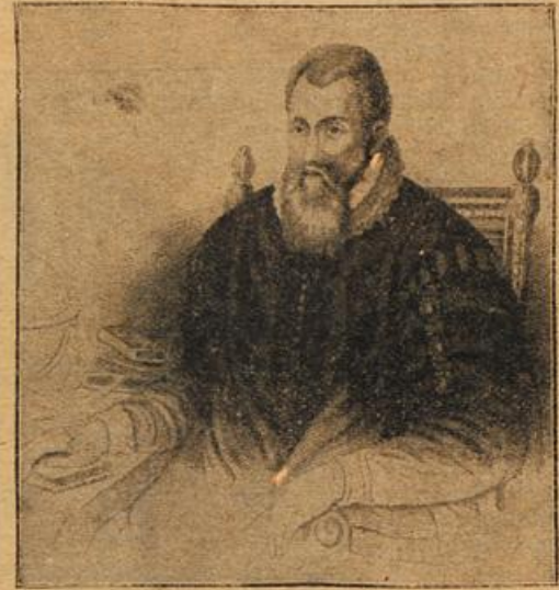
Lord John Napier, der Entdecker der Logarithmen.

Zur 300-Jahrfeier der Erfindung der „Logarithmen“: Lord John Napier, der Entdecker der Logarithmen. Die Stadt Edinburgh rüstet sich, um in diesen Tagen ihren großen, ehemaligen