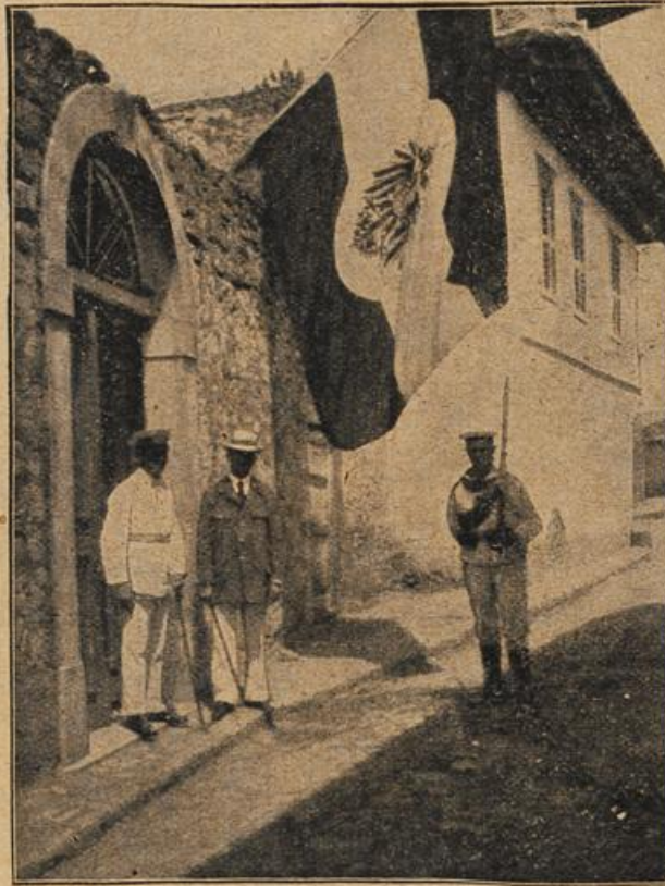
Zur Landung deutscher Truppen in Durazzo.