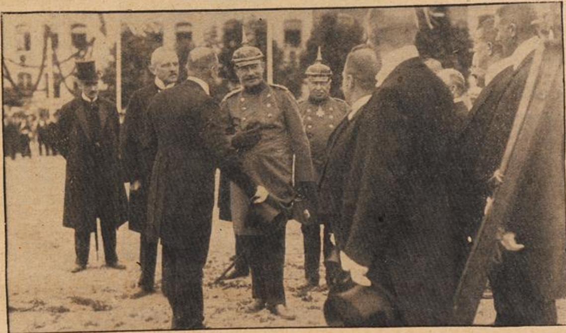
König Friedrich August von Sachsen auf einer Besuchsreise durch das Erzgebirge: Begrüßung in Olbernhau.

„Ganz ohne Zweifel, Onkel. Und ich würde bei der Sache noch gar nichts Besonderes gefunden haben, wenn Gruse vor einiger Zeit mir nicht so seltsames Zeug vorgefälscht hätte: von Schmuggeleien, von Geschäftsgeheimnissen, die der Oberingenieur ans Ausland verkauft, von seiner Freundschaft mit dem übel-