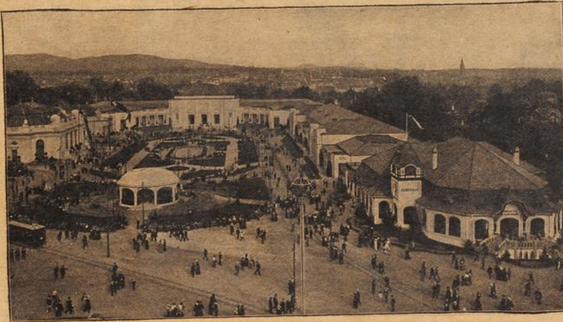
Die Schweizerische Landesausstellung in Bern.

„Daß Mama doch jetzt hinaus könnte in den hellen Sonnenschein!“ seufzte Ella an diesem prachtvollen Apriltage still vor sich