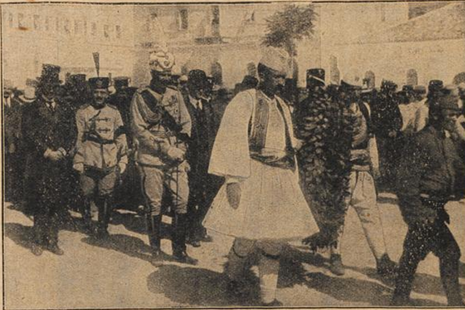
Die Ueberführung der Leiche Oberst Thomsons vom fürstlichen Palais in Durazzo nach dem Hafen.

Es ziemt sich den Bejahrten, weder in der Denkweise noch in der Art, sich zu kleiden, der Mode nachzugehen. Goethe.