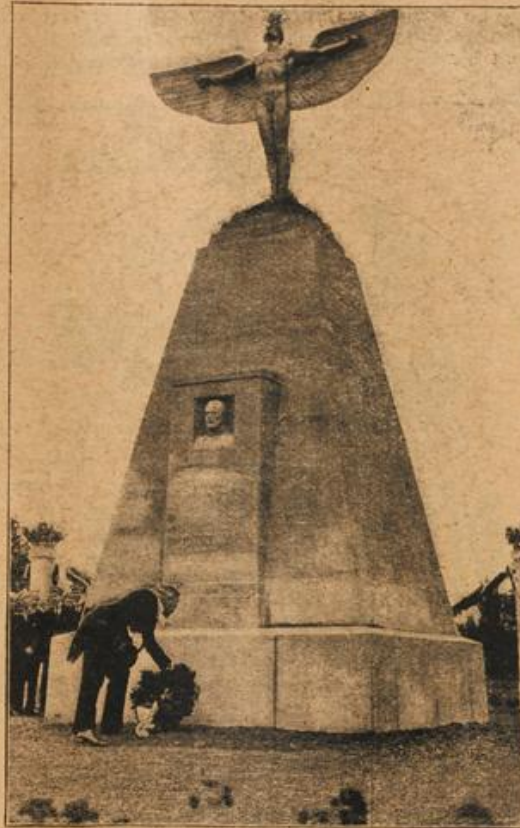
Das Denkmal für Otto Lilienthal, den Pionier der deutschen Flugtechnik, in Groß Lichterfelde bei Berlin.