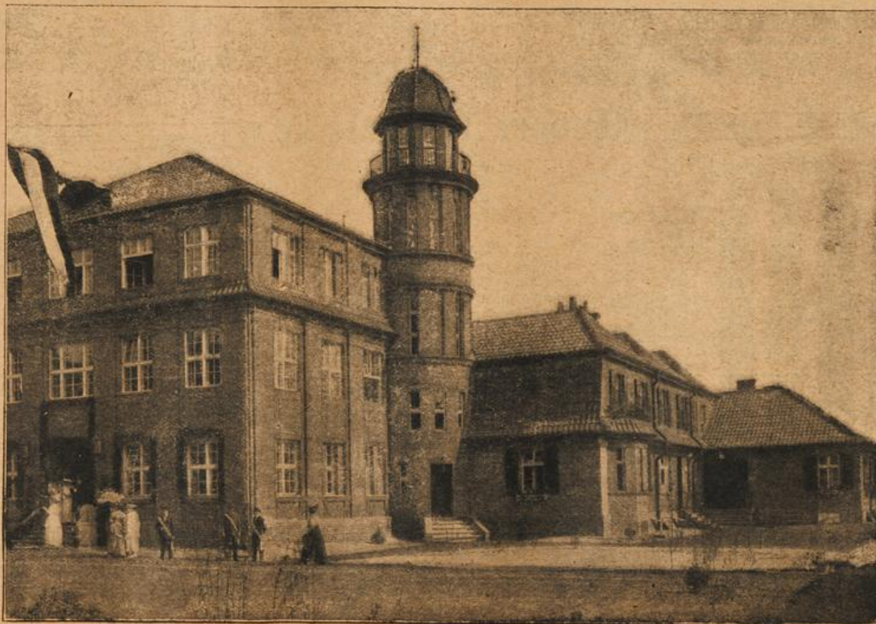
Das kürzlich eingeweihte Soldatenheim in Döberitz bei Berlin.