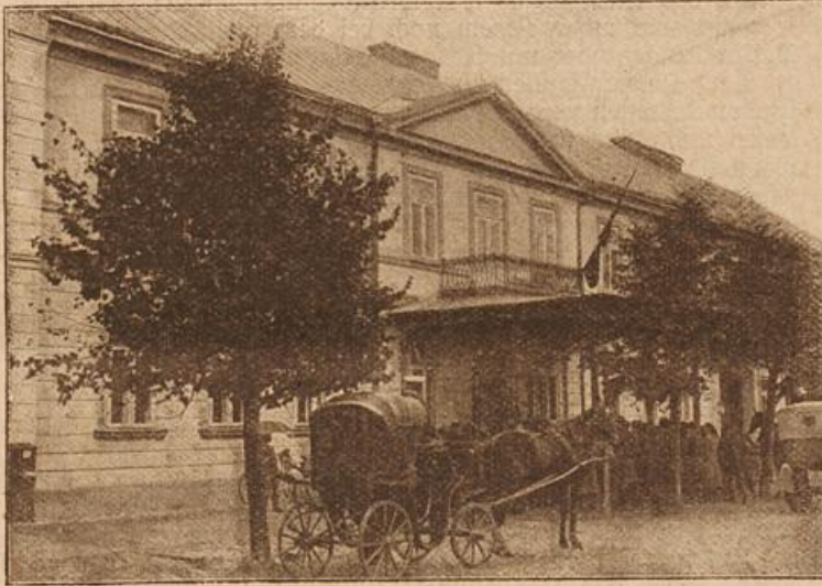
Das deutsche Gouvernementsgebäude in Suwalki. (Mit Text.)

ist. Mag alles natürlich zugegangen sein, und mir liegt nichts ferner, als Leute unnützlich in Angelegenheiten zu bringen. Also verstanden? Ich werde überhaupt den Schlüssel an mich nehmen."