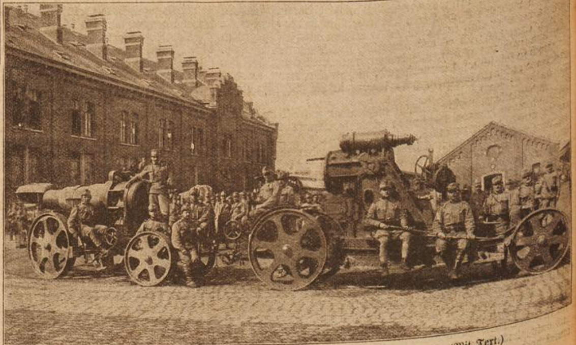
Ein österreichisches Motorgeschütz in der Brüsseler Artilleriekaserne. (Mit Text.)

chow eine rechte Antwort auf diesem klaren Wein eingeschenkt