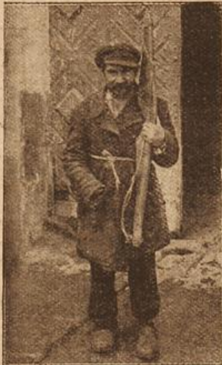
Ruß. Wasserträger in Suwalki.

Als er wieder in seinem Korbwägelchen saß, machte er sich Vorwürfe, daß er nicht den Mund gehalten hatte: „Die Sache kann sehr natürlich zugegangen sein“, beruhigte er sich. „Der alte Mann hat sich selber einen Teelöffel voll von der Mixtur eingießen wollen, und aus Versehen ist es erheblich mehr geworden. Bei einer Herzschwäche, du lieber Gott. Nachher macht man dir noch Vorwürfe, daß du ihm überhaupt eine Medizin mit einer solchen Dosis Morphium in die Hände gabst. Hättest ja jeden Abend hinausfahren und ihm selber eine Injektion machen können.“