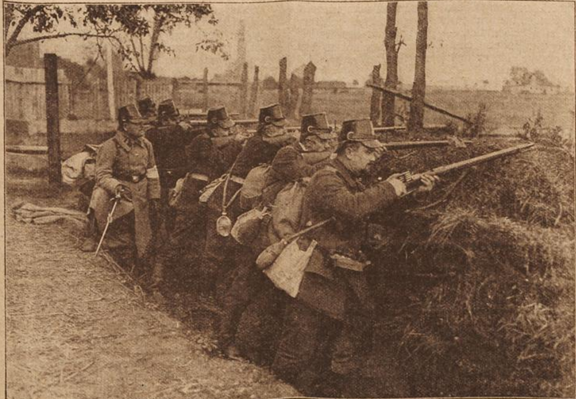
Preussischer Landsturm im Schützengraben. Die ostpreussischen Landsturmlaute haben sich durch ihre Tapferkeit und Ausdauer in der Abwehr der Russen große Verdienste erworben.

„Graf Lothar!“ riefen Vater und Tochter mit schreckensbleichen Gesichtern wie aus einem Munde, und Martin knüpfte unwillkürlich seine graue Zoppe zu, als könnte der hohe Besuch im Augenblick zur Tür hereintreten.