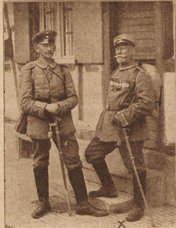
Ein 72jähr. Kriegsfreiwilliger (X), Vizefeldwebel des Landsturms Ihm, Polizeikommissar a. D. aus Straßburg. Der rüstige alte Herr hat die Feldzüge 1864, 1866, 1870/71 mitgemacht.

„Da haben wir den besten Beweis, du Unglücksrabe! Sahest du denn gar nicht, daß auf dem Zettel an der Flasche die unterstrichen stand: Abends einen Teelöffel voll? Du hast ihm also viel zuviel gegeben.“