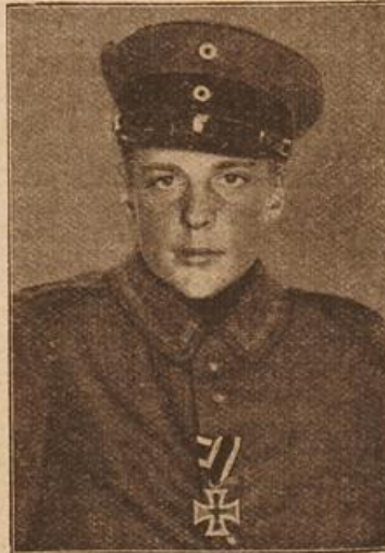
Fähnrich Günther Paulus, der jüngste Ritter des Eisernen Kreuzes. (Mit Text.)

Der Doktor zuckte wieder die Achseln, spielte mit seinem Stethoskop, zog dann seine Uhr und empfahl sich, ohne von Zuchow seine Frage erhalten und ohne zu haben. Er sah in Eile nach