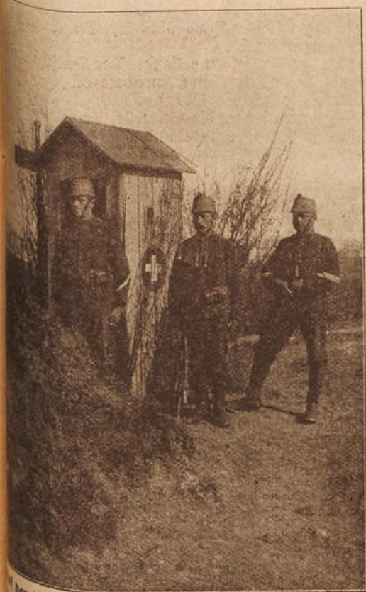
Der Grenzschutz: Schweizerischer Unteroffiziersposten bei der Verhinderung von militär. Grenzüberschreitungen. Phot. E. Schreiber.

Ramsfell und fuhr von dannen, mehr und mehr entschlossen, bei der Angelegenheit lieber nichts weiter zu machen, um nicht unnötigen Staub aufzuwirbeln.