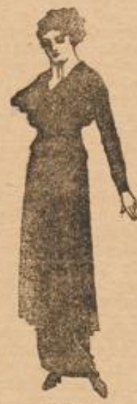
Nr. 4546. Kleid mit langem, püfftem Ueberwurf.

Nach dieser hübschen Anzug kann in schwarzem Stoffe ausgeführt, als Trauerkleid dienen, wird aber auch vorzüglich in farbigem oder auch in weitem Stoff gearbeitet, seine Wirkung nicht verfehlen. Die vorn offene Blusenöffnung ist mit kurzem Saum versehen. Die Hosen Weillenteile enden in zwei über den Rock fallende Spitzen und schließen am Hals mit einem runden, aber die Bluse fallenden Stragen ab. Glatt angelegte, blausige Ärmel werden um die Hand in ein Bündchen gefaßt, das einen Aufschlag erhält. Ueber den glatten Rock fällt ein langer, in Plüsch gelegter Ueberwurf, der, falls das Kleid in Schwarz zur Trauer passend — ausgeführt wird, einen breiten, schwarzen Strepprand bekommen kann, andernfalls jedoch ohne Befestigung bleibt. Die gemäße Vorlage ist von jeder Dame mit Hilfe eines Savoritschnittes selber auszuführen. Schnitt zur Taille unter Nr. 4046 in 44, 46, 48, 50, 52 cm halber Oberweite 60 Pf., zum Rock unter Nr. 3373 in 98, 100, 104, 108, 112, 116, 120 cm Hüftweite 80 Pf. Zu beziehen von der Modenzentrale Dresden-III. 8.