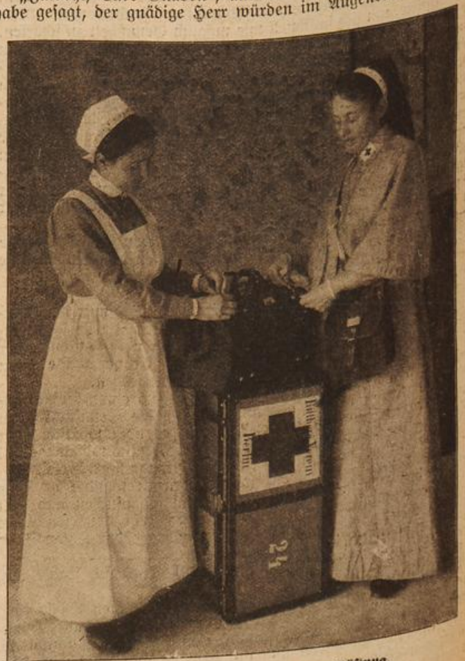
Note Kreuz-Schwester in Feldausrüstung.