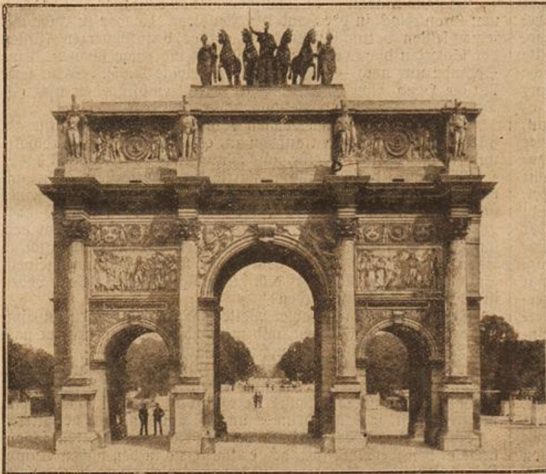
Arc de Triomphe du Carrousel in Paris. (Mit Text.)

Da brach er ab. Seine letzte Kraft schien gebrochen, aber auch der starre Trost seines Herzens.