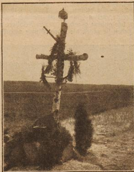
Offiziersgrab auf dem Schlachtfeld in Preußen.

ausgesprochen, so waren gleich Geistliche da, die dem armen Sünder Beichte abnehmen und den letzten Trost spenden konnten, worauf der Scharfrichter oder Henker seines traurigen Amtes waltete.