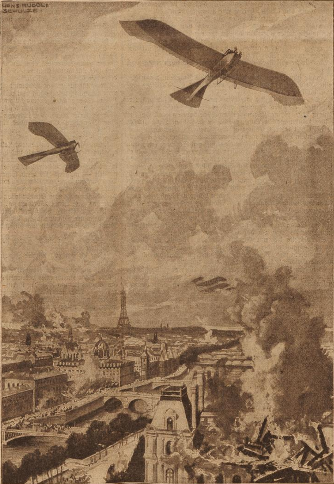
Bombenwerfende deutsche Flieger über Paris. Im Hintergrund steigt ein franz. Doppelsieder zur Abwehr auf. Gezeichnet von Prof. Hans Rud. Schulze.

Sie, mein gnädiges Fräulein, es immer taten. Für einen herzlosen Geschäftsmann halten Sie beide mich. Und damit tun Sie mir schweres Unrecht, denn niemand könnte mitfühlender sein als ich. Zum Beweise dafür will ich mich Ihnen in Ihrer jetzigen Notlage als Freund zeigen und Ihnen helfen, wenn Sie mir nur Ihre Hand reichen wollen, daß ich Sie herausreißen kann aus dem Verderben.“