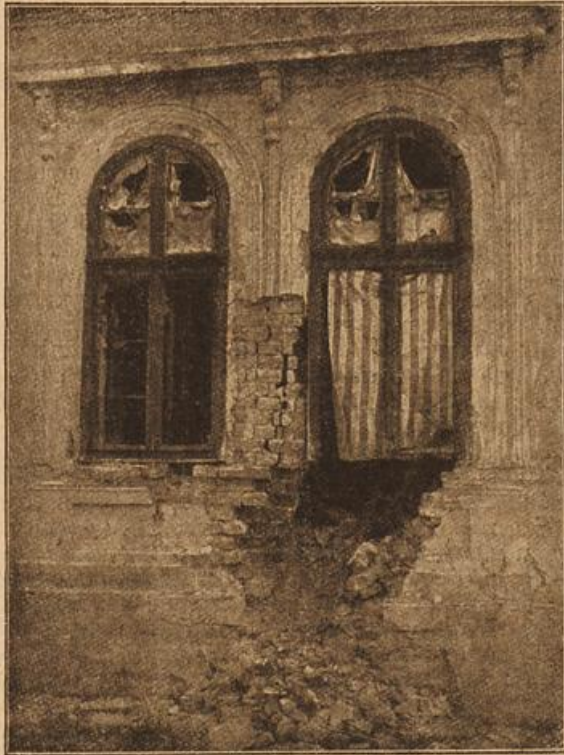
Das serbische Generalstabsgebäude in Belgrad nach der Beschießung durch die österr.-ungar. Armee.

Nachdem Lotte im Zuchow'schen Salon wohl eine Viertelstunde gewartet hatte, kehrte Kasimir mit rotem Gesicht zurück und meldete, der gnädige Herr würde im Augenblick da sein.