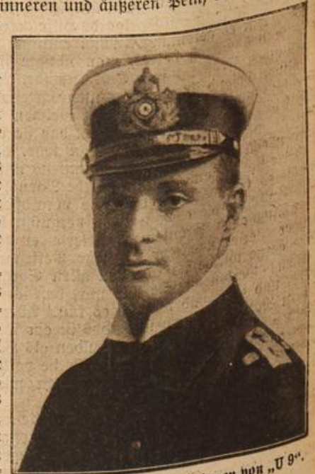
Kapitänleutnant Otto Weddingen von „U 9“. (Mit Text.)

„Jawohl, Euer Gnaden“, antwortete der Diener. „Und ich habe gesagt, der gnädige Herr würden im Augenblick dort sein.“