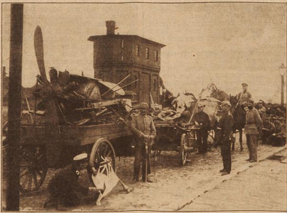
Ein von Oberst v. Hindenburg erbeuteter russischer Flugzeugpark. (Die Maschinen wurden auseinander genommen und nach Deutschland transportiert.)

Die beiden Mädels glichen in der Tat zwei großen Bündeln von Decken und Tüchern. Doch schienen sie sehr fidel zu sein, denn sie quetschten und lüchelten in ihren Umhüllungen, wie wenn sie das Ganze für einen Mästen scherzhielten. Schnell waren sie drinnen geborgen. Und nun schlang Lottchen ihre Arme zärtlich um des Vaters breiten Nacken, schaute ihm fest in die trübe blickenden Augen, als müßte sie ein Geheimnis darin entdecken und jagte dann, nicht