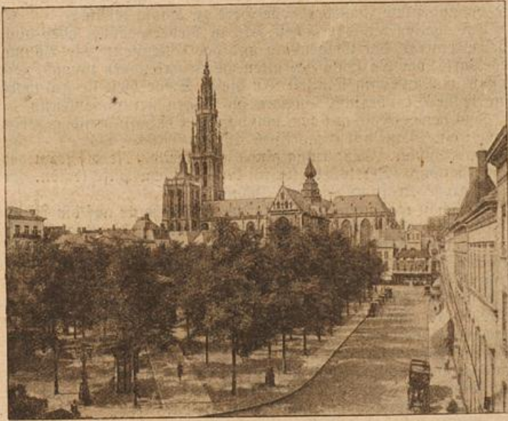
Die Kathedrale von Antwerpen. (Mit Text.)

„Sie hat Kopfschmerz gehabt und ist darum noch spazieren gegangen. Was ist denn dabei in dem milden Wetter? Du bist unklug und rein närrisch in deiner Eifersucht! Lotte denkt über Zuchow genau