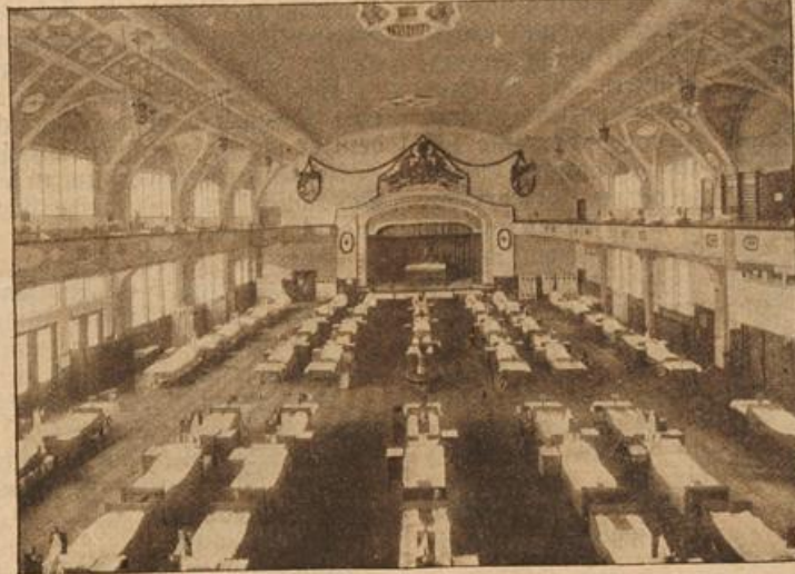
München: Die größte und schönste Turnhalle Deutschlands (des Männerturnvereins von 1879) wurde in ein Lazarett mit 170 Betten nebst Operationssälen und Verbandsträumen umgewandelt.

Ein Stahlpfeil, wie er nach Mitteilungen in englischen Blättern zum Abwerfen aus Flugzeugen über Truppenmassen verwendet worden sein soll; die Pfeile sollen erhebliche Verletzungen verursachen.