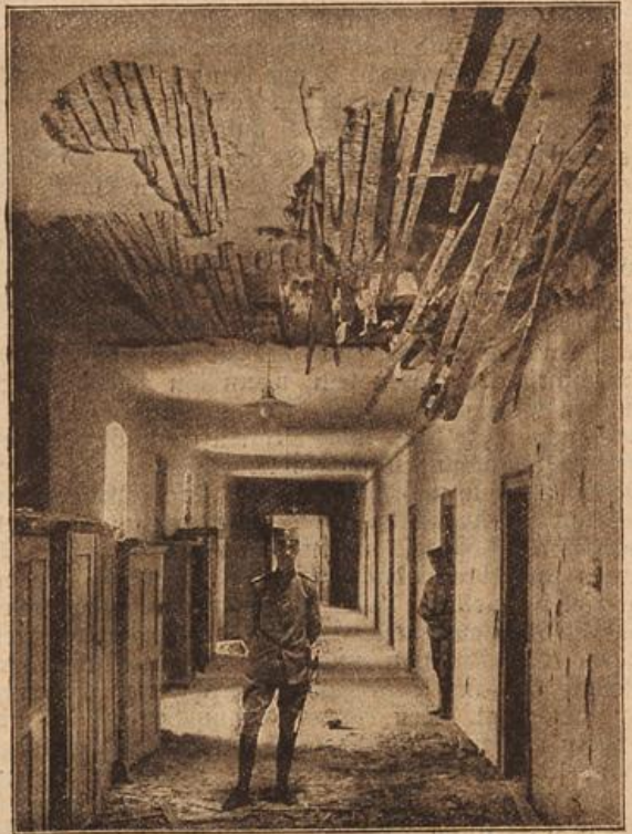
Abbau des serbischen Königspalastes in Belgrad nach der Beschießung der Hauptstadt von Semlin aus.

„Nanu, was will denn der?“ fragte der alte Herr sich überrascht, während er hastig den Umschlag öffnete, „erschrieb doch erst vor ein paar Tagen und wünschte uns ein frohes Fest und gute Gesundheit, wie seit dreißig Jahren.“