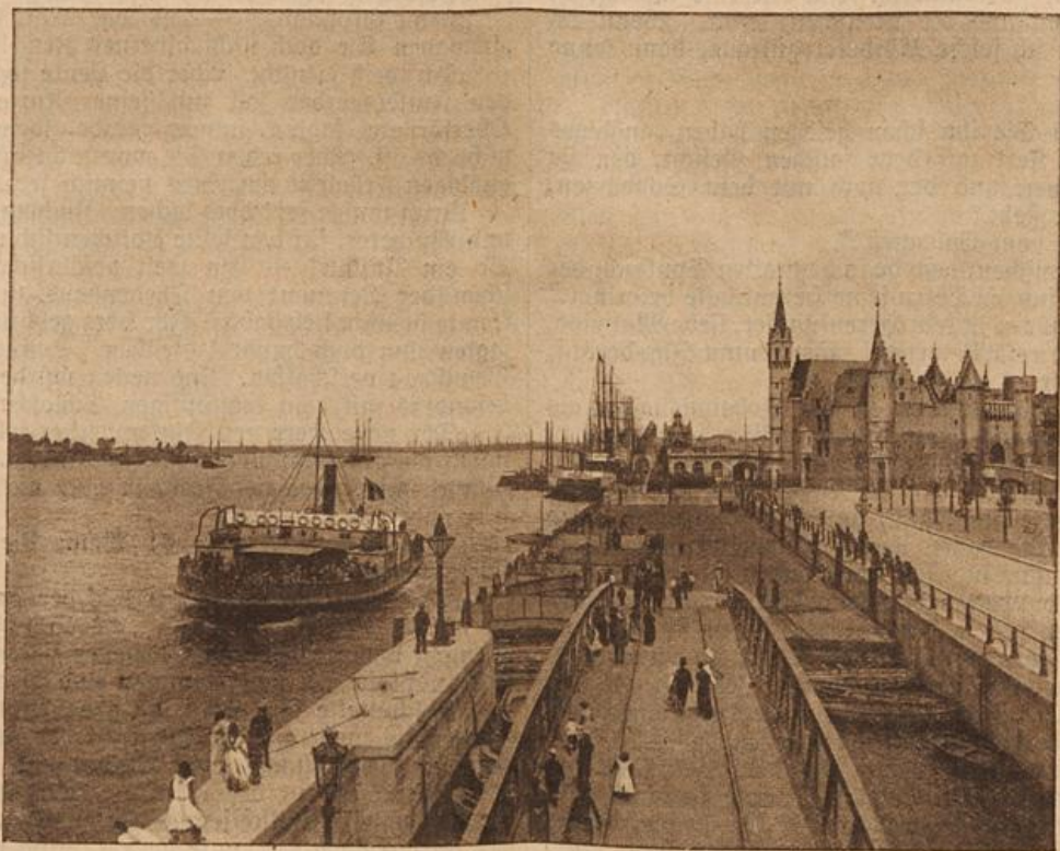
Der Hafen von Antwerpen: Rechts das Altertumsmuseum „Het Steen“, der Überrest der alten Burg von Antwerpen. (Mit Text.)

konnte es nicht verborgen bleiben, daß ihn etwas quälte und beunruhigte. Wenn sie doch nur eine Ahnung gehabt hätte, um was es sich handelte! Warum war der Vater auf einmal so furchtbar wortfarg und brummig geworden? Warum wichen die Grüblerfalten überhaupt nicht mehr von seiner Stirne, warum seufzte er bisweilen so schwer und redete ungereimtes Zeug in tiefen Gedanken vor sich hin? Als drückte ihn eine Schuld, kam es ihr vor. Und der Bankier mußte die Veranlassung zu dieser ganzen unheimlichen Veränderung gewesen sein. Daß sie doch wenigstens mit Ulrich einmal klar darüber sprechen könnte! Ja, heute wollte sie den bestimmt auffuchen in seiner Einsamkeit.