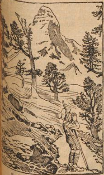
Wo ist der Tourist geblieben?