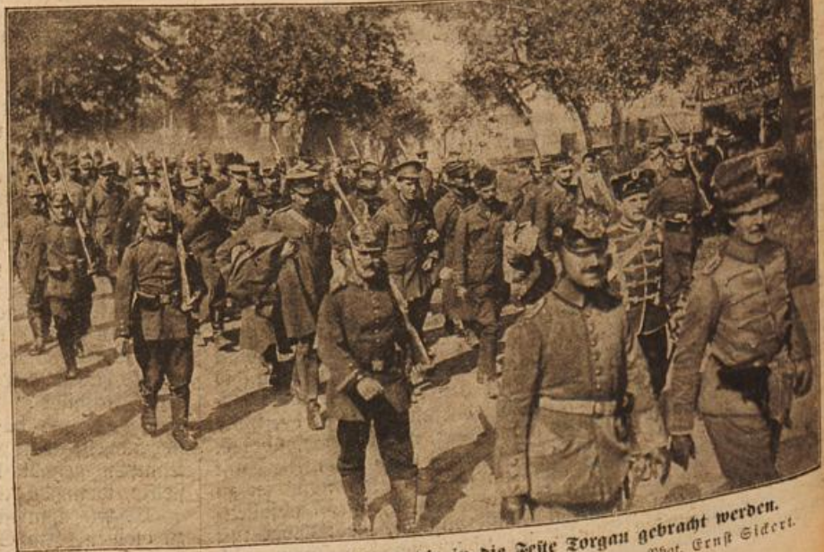
Kriegsgefangene feindliche Offiziere, die in die Feste Torgau gebracht werden. Vorn Schotten und Engländer, hinter ihnen Belgier, zum Schluß Franzosen.

Die drei Brüder kamen in den nächsten Tagen, saßen schwermütig drinnen oder begleiteten Ulrich auf seinen Reviergängen