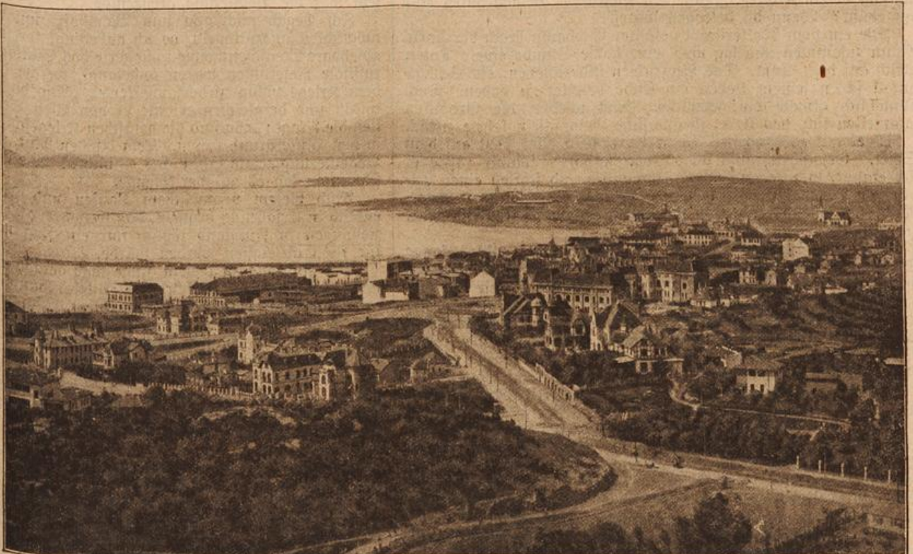
Blick auf die Hauptstadt Tzingtau. (Mit Text.)

Seinen goldenen Klemmer auf die Nase setzend und sich in einen Sessel niederlassend, begann der Oberförster zu lesen. Doch schon nach wenigen Sekunden wurde sein faltiges Gesicht wachsbleich und das Papier entglitt den zitternden Händen.