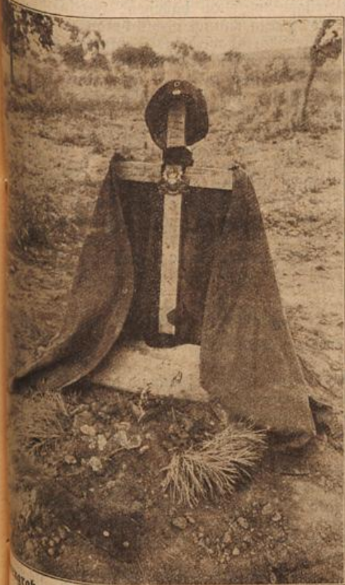
Grab zweier Bahr. Offiziere an der lothr. Grenze. (Mit Text.)

das übermütige Lachen schienen sie ganz verlernt zu haben. Wunder: den Vater sahen sie immer nur mit bekümmertem Miene und in einer gar schrecklichen Laune, der Freund, der in den Herbstferien so lustig einfonnte, schien ebenfalls von einer schweren Sorge bedrückt, Lotte und das Kropfzeug nicht da, von Mutter aus dem Sanatorium durchaus keine erfreulichen Nachrichten — graues Elend ringsum. — Wer mochte da lachen und fröhlich sein! Kam die größere Schwester auch einmal herüber aus der Stadt, um in der