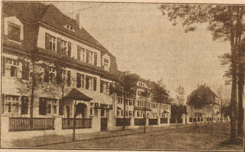
Die neuen Eisenbahnbeamtenhäuser in Coswig i. S. (Mit Text.)

Ich war zu jung, zu frivol, um ihn zu verstehen, ich wollte ihm alles sein, sein Gott, seine Welt, er sollte außer mir nichts denken und nichts wünschen. Und so quälte ich ihn und mich, da ich an seiner Liebe zu zweifeln begann. Und nun hier sein letzter Brief: