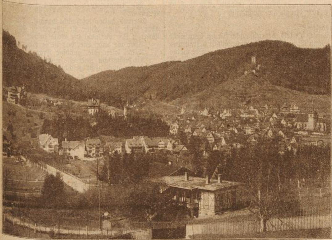
Liebengzell im württembergischen Schwarzwald. (Mit Text.)

Drei Tage vor der Hochzeit Gertruds mit dem Doktor Bernicke war Frau Wagnik nach Rügenwalde gefahren, um die letzte Hand an die Einrichtung des neuen Heims zu legen, während die Kommerzienrätin mit den Kindern eine Geburtstagsvisite bei einer Freundin machte. Es war ein prächtiger, sonnenheller Vormittag zu Anfang des April. Gertrud hatte wohl eine Stunde lang im Wintergarten gesessen und in einem Buche gelesen,