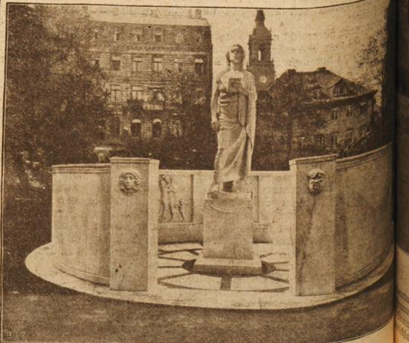
Das neue Schiller-Denkmal in Dresden. (Mit Text.)

Daß Sie nicht gegen den Wunsch Ihrer Mutter eine Ehe eingehen wollen, ist lobenswert. Kann ich andererseits Ihrer Mutter, die noch heute ihren Gatten beweint, der auf dem Kriegsschauplatz sein junges Leben verloren, kann ich ihr verargen, wenn sie ihre Tochter vor einem ähnlichen Los bewahren möchte? Und kann ich meinem Vater, der an der Spitze seines Regiments kämpft, und der mit Leib