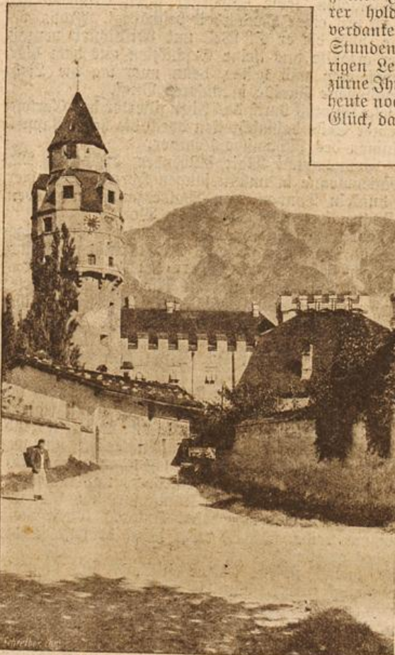
Der Münzturm in Hall am Inn. (Mit Text.)

nicht mich, sondern die unergründlichen Mächte, die unsern Lebenslauf bestimmen.