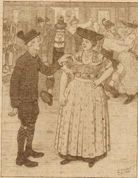
Mittels. Sommerfrischer: „Kann, Dirndl, du stehst so allein? Mochtest du 'ne Tour mit mir tanzen?“ Dirndl: „Na, Sie taten mir leid, mei Bua verhaut an jeden, der mit mir tanzen möcht!“

In die weite Welt. Sie kommen noch vor, diese traulichen Winkel, die von der Woge des Weltverkehrs noch nicht erreicht wurden, in alten Städtlein, die noch keine Bahn haben, die nur mehr durch den Postwagen mit der großen Welt in notdürftiger Verbindung stehen. In solch einem Nestlein bekennt es sich noch etwas ganz anderes, wenn einer seiner Söhne sich herausmacht, sein Glück oder doch seinen Lebensweg in der weiten Welt zu suchen, und wäre es auch nur in der nächsten Seminar- oder Universitätsstadt. Für das Mutterherz, das Abschied auf Monate von dem Sohne nehmen muß, ohne sich vorstellen zu können, in welche Verhältnisse der „Junge“ da draußen kommt, ob er auch wie zu Hause richtig betreut und versorgt wird, ist das eine Trennung über Berge und Meer. Sie ist eine alte Frau, die nie aus ihrer Enge herauskam, und wer sagt ihr, daß sie es noch erleben wird, wenn der Sohn zu den Ferien heim darf. Wer sagt es ihr ferner, daß er als der alte, gute, unverdorrene Junge, den sie so lange wie ihren Augapfel gehütet hat, heimkommt aus der weiten Welt? Das sind Abschiedsfragen, bange Zukunftsfragen, die hier Gestalt gewonnen haben unter des Malers Hand in dem traulichen Winkel am Tore unter den Fenstern des alten Gasthofes „Zur Post“. Wie oft wird das Mutterherz mit seinen Sorgen und Gedanken von dieser Stelle aus die Wanderung antreten in die Ferne, in die ihr unbekannt, fremde und daher wie etwas bedrohlich Feindliches, rätselhaft Verschlossenes erscheinende weite Welt!