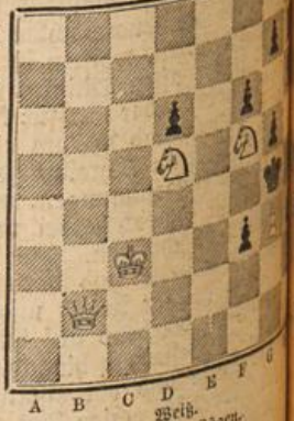
Weiße. Matt in 8 Zügen.

Von E. Ferber in St. Gallen. (Deutsche Schachzeitung 1908) Schwartz