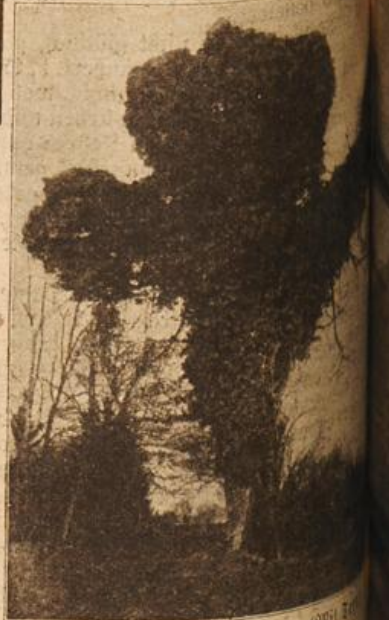
Ein seltsamer Baum. (Mit Text.)

Flehen Sie mich, Sie um mein Vertrauen in mich, in die Zukunft, Sie haben beides verloren! Sie begehren