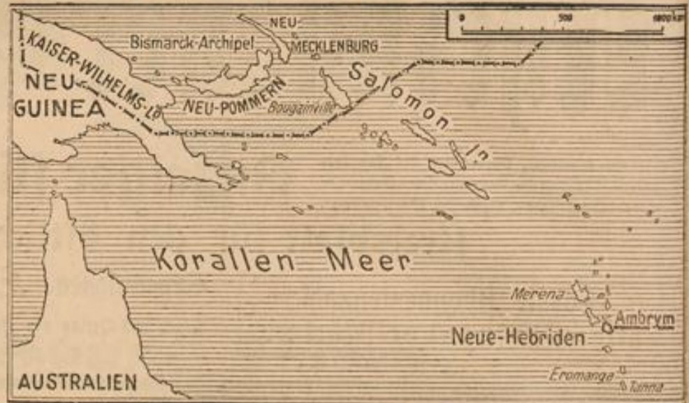
Karte zu der Vulkankatastrophe im Stillen Ozean.

Auf der Insel Ambrym haben furchtbare vulkanische Ausbrüche stattgefunden, bei denen Hunderte von Eingeborenen durch Lavaströme abgeschnitten wurden. Siebenhundert jedoch gelang es zu entkommen. Durch das Erdbeben hat sich die Lage auf Ambrym vollständig verschoben. Es sind Landteile verschwunden und vom Meere bedeckt, während andere Landteile aufgetaucht sind. Die Insel gehört zu den Neuen Hebriden. Diese bestehen aus 26 größeren und kleineren Inseln, die zusammen 13.227 Quadratkilometer groß sind. Die Inseln sind hoch und gebirgig und bestehen in der Mehrzahl aus jungvulkanischen Gesteinen. Die Bewohner (etwa 50.000) sind Melanesier, mit polinesischen Elementen gemischt, die noch zum größten Teil dem Kanibalismus ergeben sind.