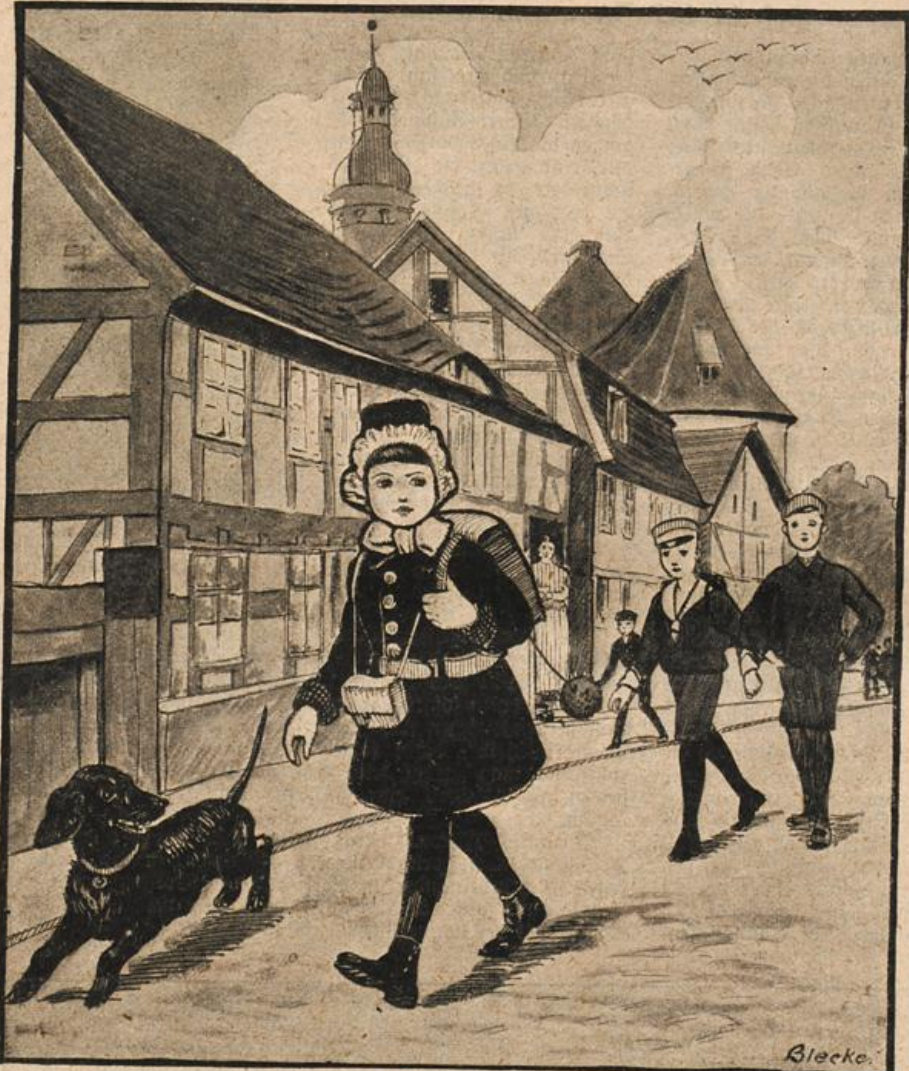
Auf dem ersten Schulgang.