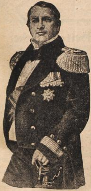
Prinz Adalbert von Preußen.

Ein halbes Jahrhundert war in diesen Tagen verfloßen, seit die preußische Marine, die gerade in unsern Tagen dank der Uebernahme durch das Deutsche Reich einen so gewaltigen Aufschwung genommen, daß sie heute die zweite Stelle unter allen Seemächten der Erde einnimmt, ihre Feuer-taufe zu bestehen hatte.