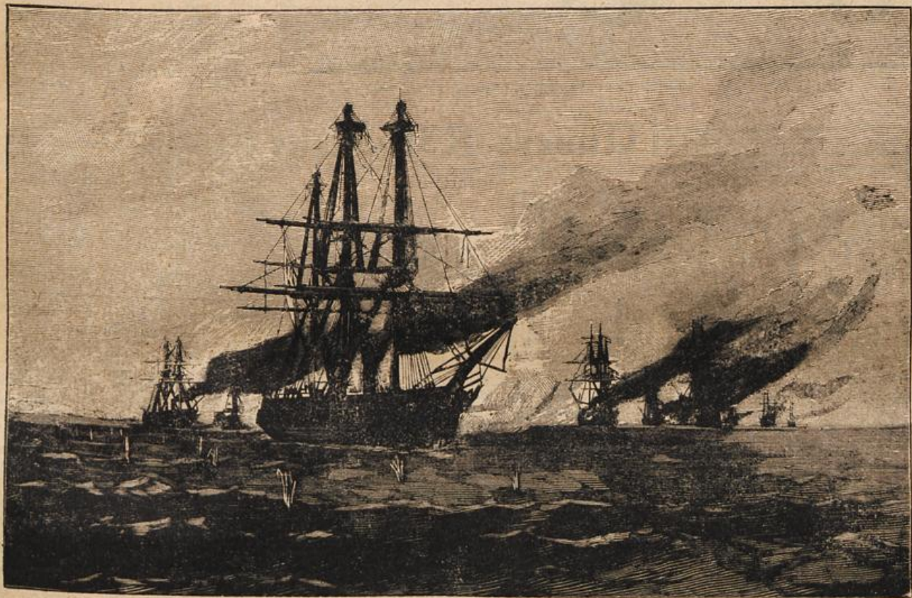
Das Seegefecht bei Zasmund am 17. März 1864. Nach der Kreidezeichnung eines Gefechtsteilnehmers.

Preußens „Arcona“ traf später mit ihrem alten Gegner „Sjöldland“ noch zweimal friedlich zusammen; am 15. Nov. 1869 lagen sie nebeneinander in Port Said bei Eröffnung des Suezkanals, und am 13. Juli 1873 im Hafen von Trondhjem bei Gelegenheit der norwegischen Krönung.