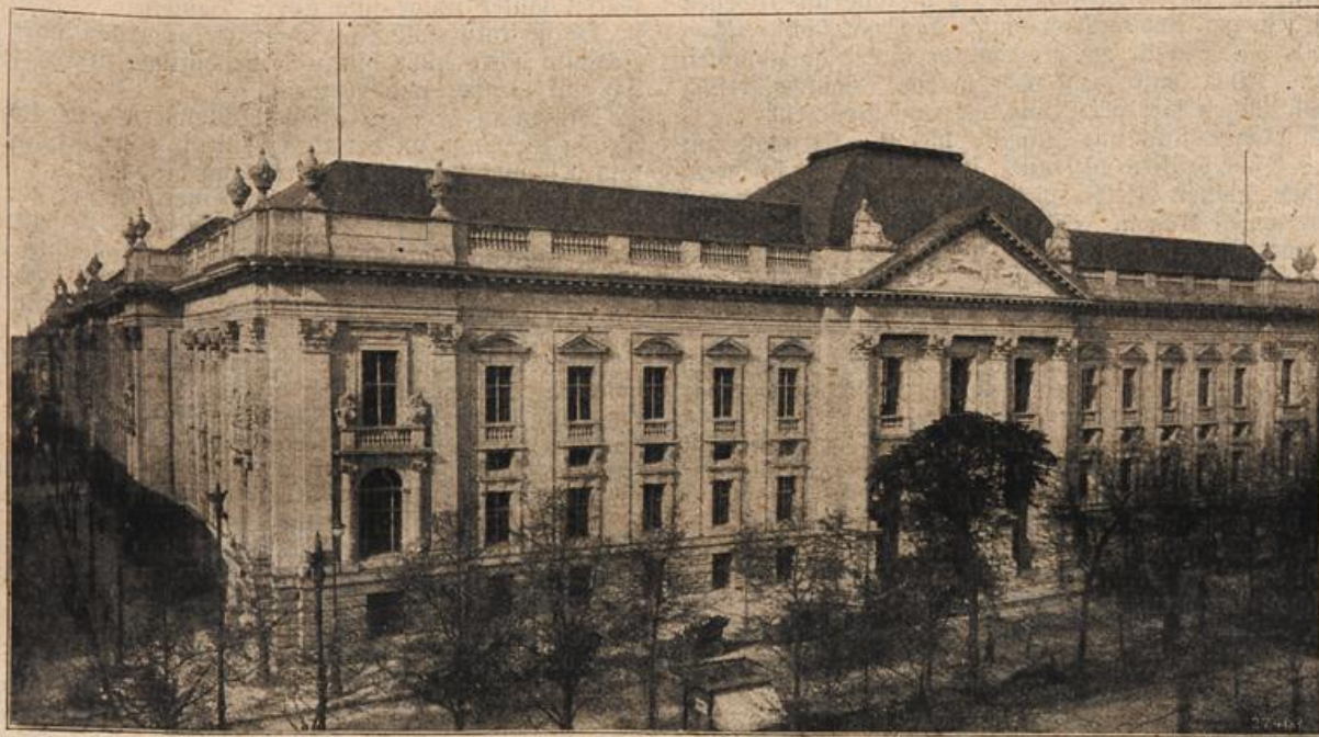
Der Neubau der königlichen Bibliothek in Berlin.

Ein festliches Mahl hatte der Wirt den seltenen Gästen hergerichtet. Durch die weite Halle des Speisesaales streckte sich eine blumengeschmückte, blütenweiße Tafel mit vielen Gedecken. Alle, die gerade auf der Berghöhe weilten, hatten auf die Kunde, Luftschiffer kämen, den Wirt bestürmt, diese Stunde würdig zu begehen, denn sie bliebe einzig in der Geschichte der Schmüde, hatten