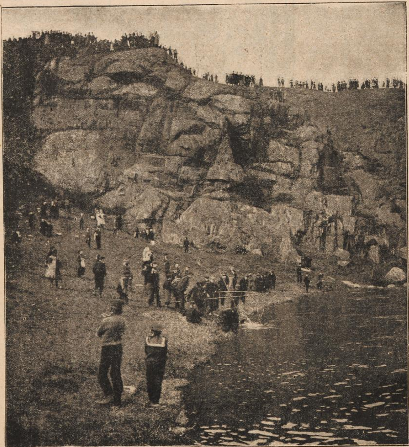
Eierschieben am Fuße des Proitschenberges.