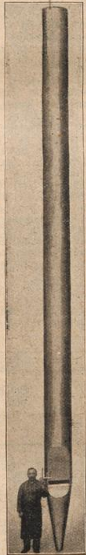
Die größte Orgelpfeife der Welt.

In dieser Orgel befinden sich insgesamt 12 173 Pfeifen, zumeist aus Zinn, aber auch aus kanarischem Föhrenholz hergestellt, in allen Größen. Das Gebläse besteht aus zwei Luftschleudermaschinen mit je 1350 Umdrehungen in der Minute; diese sind mit 2 Gleichstrommotoren von je 5 Pferdekraften gekuppelt und liefern für das Hauptwerk 95 Kubikmeter „Wind“ in der Minute. Der „Spieltisch“ (mit Manualen, Registern, Pedalen) nimmt eine Fläche von 4 Quadratmetern ein u. hat ein Gewicht von 1400 kg. Dem Organisten stehen 207 Registerzüge, 74 Druckknöpfe, 28 Tritte, eine Walze und 828 Kombinationsknöpfe zur Verfügung. Die Godtfroy-Familien-Stiftung hat die Geldmittel hergegeben; Erbauer der Orgel sind E. F. Walder u. Co., Ludwigsb. S. Herzberg.