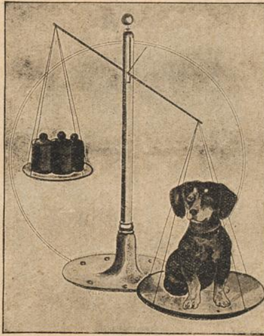
Ein schwerer Junge.

versunkene Wälder oder wie ein wogendes Kornfeld aufragt. Dazu kommen nun die Schwärme der Meerestiere verschiedenster Art. Fische der mannigfaltigsten Form und Farbe, Krabben und Einsiedlerkrebse, Seewalzen und Seesterne. Alles das überschaut der Fahrgast dieses Bootes von einem bequemen Platz aus durch den gläsernen Boden.