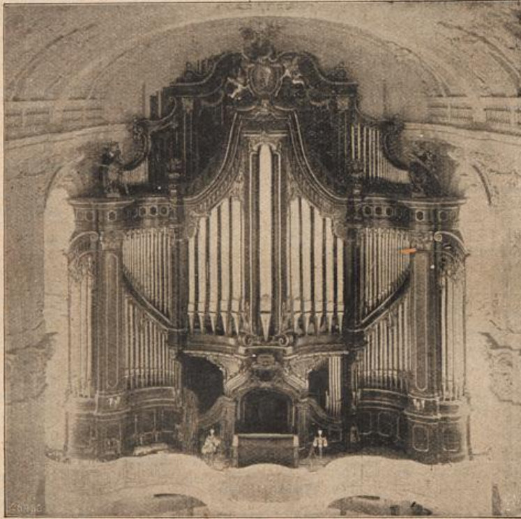
Die größte Orgel der Welt,

gebracht oder ausgeschlossen werden können, was durch die sogenannten Registerzüge geschieht. Die Orgel in der St. Michaeliskirche umfaßt nun auf fünf Manualen (Klaviaturen) von je 61 Tasten und auf einem Pedal von 32 Tasten im ganzen 163 klingende Stimmen (Register) und hat für diese 125 „Koppeln“ und Nebenzüge. Hierin sind 22 Stimmen des Fernwerkes mit einbegriffen. Das Fernwerk, das vom fünften Manual aus gespielt wird, ist eine kleine Orgel für sich und