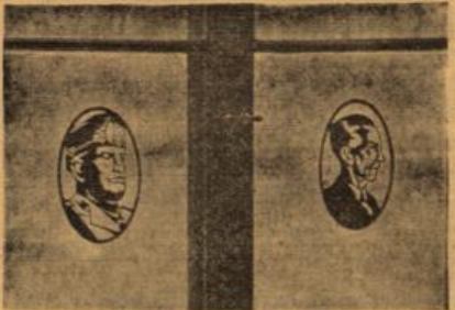
Zwei Eisenwerke, gefertigt aus Sperrholz, als Fährtenbaum. Balkenarbeiten eines verwundeten Soldaten

• Weihnachtsausstellung in Wiesbaden. Der Kaiserliche Hof der Kaiserin, ein Bild an die Freude, die Seite, ein gebildeter Hummus, der aus Frühling zu flüchtiger Klarheit erwacht. Die mühsame, scheinbare Technik des Tänzerischen, die gute Durchbildung und Scharfheit der Körper, machten die Gesamteindruck der Gruppe zu einem beglückenden Erlebnis. Die Tänzerinnen waren durchwegs schön, daß aus der Schönheit von Schmitz und Gärten ergab sich ihre harte Wirkung. Kapellmeister Ernst Schall leitete das kleine Orchester umfänglich und war den Tänzern ein einfühlsamer Begleiter.