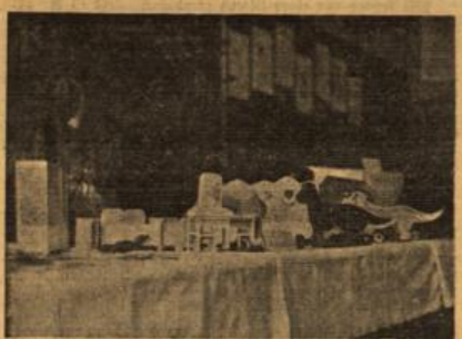
Reich befehligt waren die Tische auf der Ausstellung von Balkenarbeiten in einem Wiesbadener Kasernebetriebe

Das Jungvolk sammelt am heutigen Mittwochnachmittag in den Wiesbadener Haushaltungen Werkzeuge und wenn möglich auch Materialien, die zu Balkenarbeiten aller Art Verwendung finden können. Alle gespendeten Gegenstände sollen unseren Soldaten zur Verfügung gestellt werden, um ihnen die Möglichkeit zu geben, ihre Freiheit schnellmöglich zu erhalten zu können. Beim Truppenbesitz an der Front steht zwar für diese Zwecke weniger Zeit zur Verfügung als beispielsweise in den Kasernebetrieben der Heimat. Aber hier spielt die Beschäftigung mit Balkenarbeiten