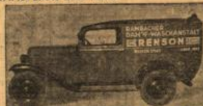
Benz-Dampf-Waschanstalt, Emil Rensen Söhne

Unsere Kunden pünktlich zu beliefern ist unser Bestreben!