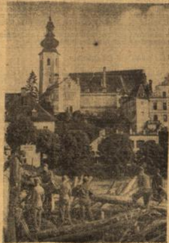
Schwere Hochwasserkatastrophe in der Steiermark. Pioniere beistehen an der Mauerbrücke in Frohnleiten die angeschwemmten Holzmassen.

Eine Bombe explodiert im Koffer. Auf der Hauptstraße von Rotterdam, dem Coolingsing, ereignete sich am Montag in den Mittagsstunden eine geheimnisvolle Bombenexplosion, durch die eine Person getötet und zwei schwer verletzt wurden. Wie die polizeiliche Ermittlung bisher ergeben hat, ist an der Explosionsstelle ein Mann mit einem Koffer, in dem sich offenbar die Bombe befunden hat, gefangen worden. Die Bombe muß im Koffer explodiert sein und hat den Unbekannten bis zur Unkenntlichkeit zerstört. Die benachbarten Geschäftshäuser erlitten durch die Explosion, die mit furchtbarer Wucht erfolgte, schweren Schaden. Somit bisher bekannt geworden ist, wurde bei dem von der Bombe getöteten Mann ein holländischer Kapitän, der auf den Namen Kovac, gefunden. Es wird gegenwärtig untersucht, ob der Tote mit der im Koffer befindlichen Person identisch ist. Bei dem Getöteten wurde ferner eine Reihe von Hotelrechnungen aus verschiedenen europäischen Hauptstädten gefunden. Die holländischen Blätter sprechen die Vermutung aus, daß der Mann im Dienste einer internationalen Terroristenorganisation gestanden hat, die ihren Sitz in Prag hat.