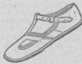
von Mk. 2.50 an.

Schuhkonsum 19 Kirchgasse 19 an der Luisenstraße.