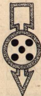
Geperrt für Fahrzeuge aller Art einschließlich Handkarren sowie für Radfahrer, Reiter und Viehtreiben.