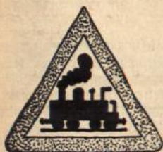
Achtung! Unbewachter Bahnübergang.

Durch Reichsgesetz vom 8. Juli 1927 (R. G. Bl. S. 177) sind für den Kraftfahrzeugverkehr neue Warnungstafeln eingeführt worden. Die Warnungstafeln haben Dreiecksform und sind außen mit einem Rand aus signalroter Farbe versehen. Untergrund weiß, Zeichen schwarz. Die auf den Warnungstafeln befindlichen Zeichen bedeuten: