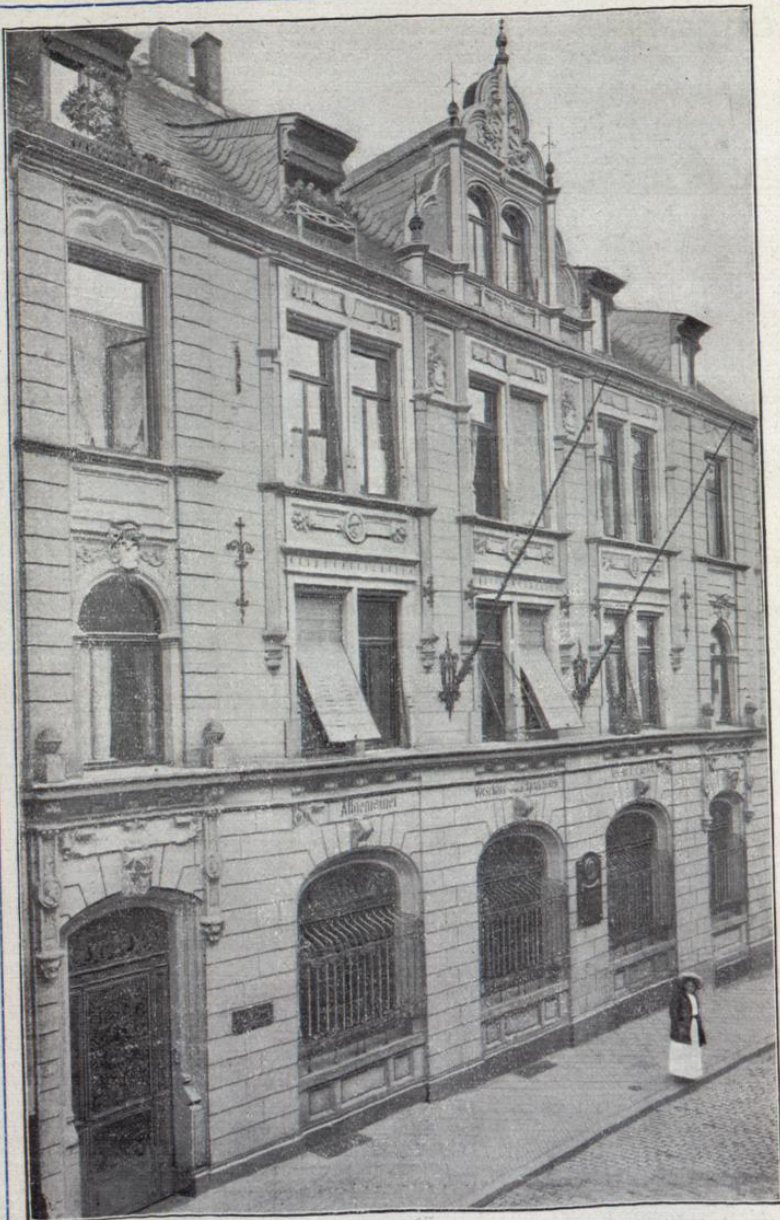
Allgemeiner Vorschuss- und Sparkassen-Verein zu Wiesbaden G. m. b. H.