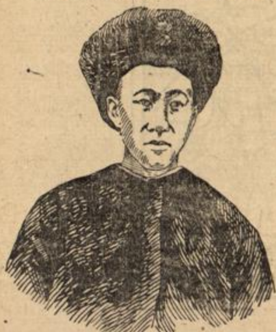
Prinz Tschun, der chinesische Sühnegesandte in Berlin.

Seute, Montag, 26. August, sollte die chinesische Sühnegesandtschaft unter Führung des Bruders des Kaisers von China, Prinz Tschun, am Berliner Hofe eintreffen, weshalb wir unseren Lesern bestehend ein Portrait des genannten Prinzen geben. Sein Eintreffen in Potsdam geschah mit großer Geleise. Der Prinz residirt im Neuen Orangeriegebäude zu Sanssouci, und wird vom Kaiser im Berliner Schloß am 27. August in feierlicher Audienz empfangen. Bei dieser Audienz im Weißen Saale sollen das kaiserliche Hauptquartier, die Generalität, die Admiralität, der Reichskanzler, die Staatsminister usw. zugegen sein. Als militärische Begleiter sind dem Prinzen beigegeben der Generalmajor v. Höpfer, der an der chinesischen Expedition teilgenommen hat, und Major Freiherr v. Lütow vom Generalstab des Gardekorps. Man hat den Hauptakt der Sühnemission mit Absicht nach der Hauptstadt des Deutschen Reiches verlegt und wird deshalb Prinz Tschun am 27. August von Potsdam nach Berlin fahren und dort vom Potsdamer Bahnhof durch