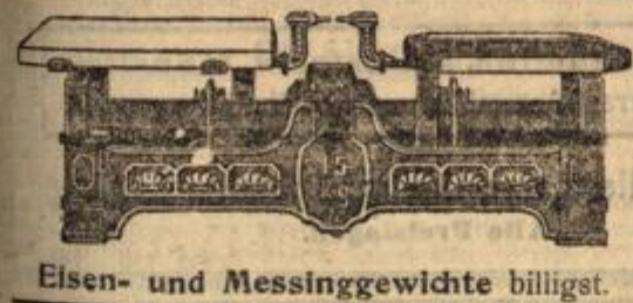
Eisen- und Messinggewichte billigst.