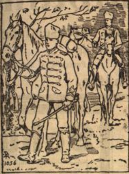
Es ist der Bauer, der den Reiter den Weg zum nächsten Dorf zeigt?