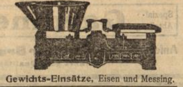
Gewichts-Einsätze, Eisen und Messing.