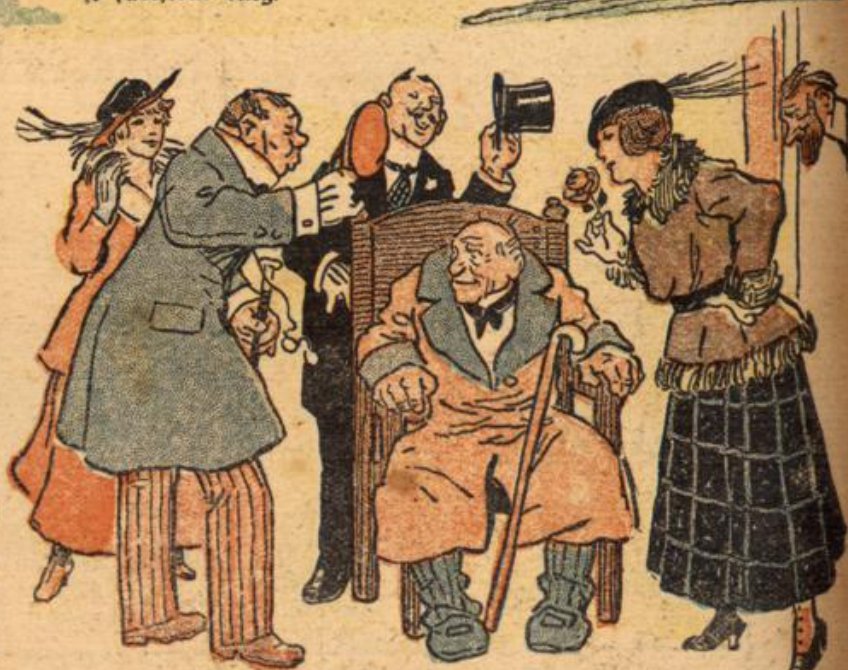
and alle Neffen und Nichten sind auf einmal so aufmerksam, und hüllen dich, — falls du bei Geld bist, — in lauter Liebe ein.