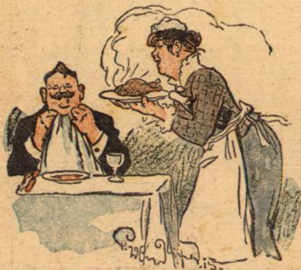
Die Dienstmoten sind von einer ausgefuchten Lebens- würdigkeit —