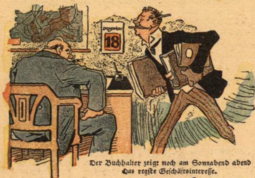
Der Buchhalter zeigt noch am Sonnabend abend Das regste Geschäftsinteresse.