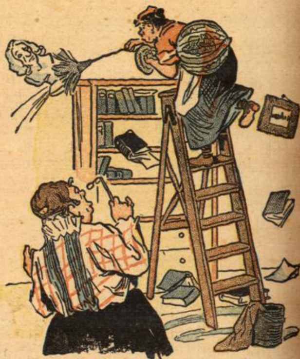
Das Dienstmädchen wird von der Keinemachewei befallen.