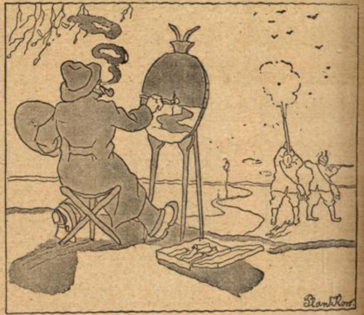
Kein Mensch kauft meine Bilder je . . . Doch halt ich hab' eine Idee.