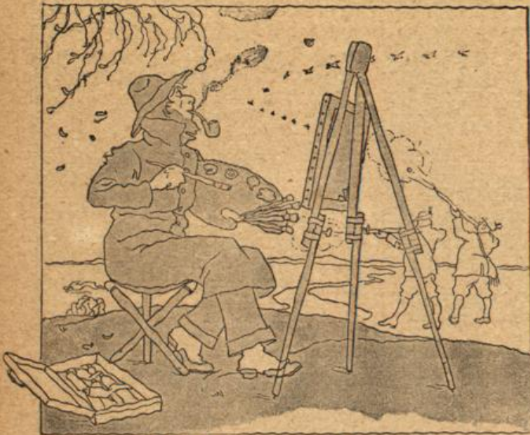
Die weil die Sonntagsläger „sagen“, Mus ich von früh bis spät mich plagen.