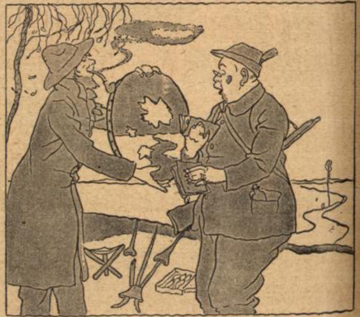
Ein Schuß . . . ein Knall . . . Was ich gemalt, Ward mir zum erstenmal bezahlt.