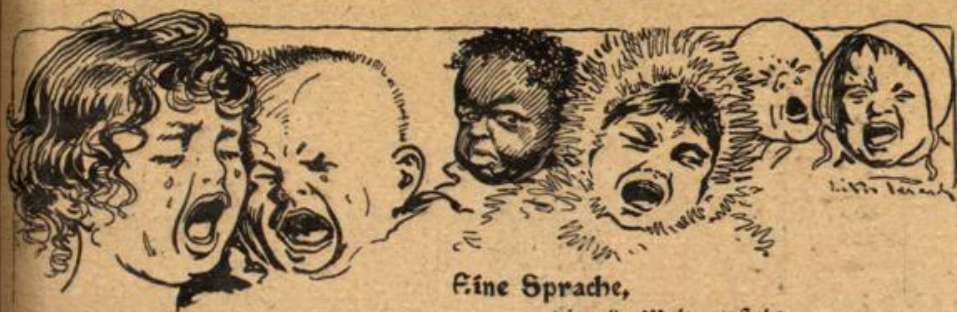
Eine Sprache, die alle Welt versteht.