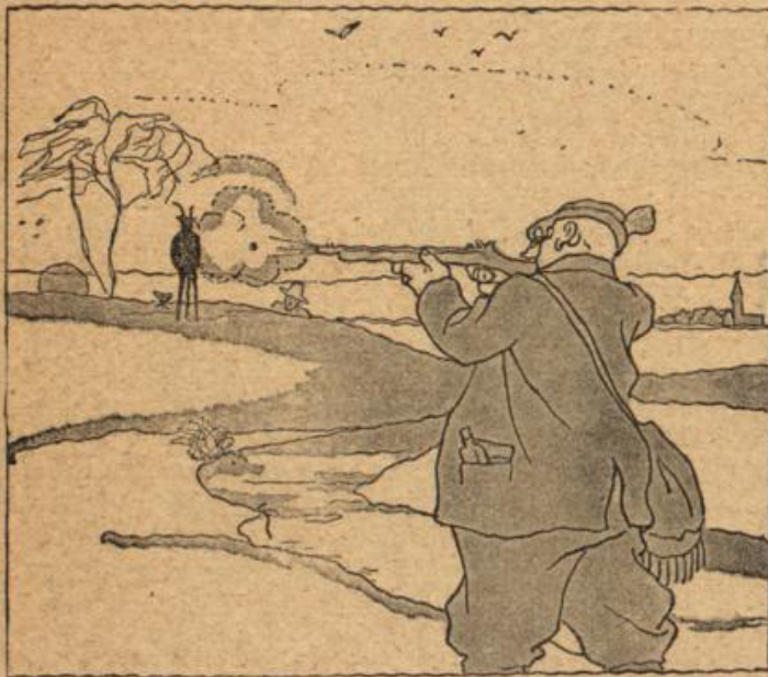
Zwei Hörner auf das Bild gesetzt, So ist das Bild — ein Geisbock fest.