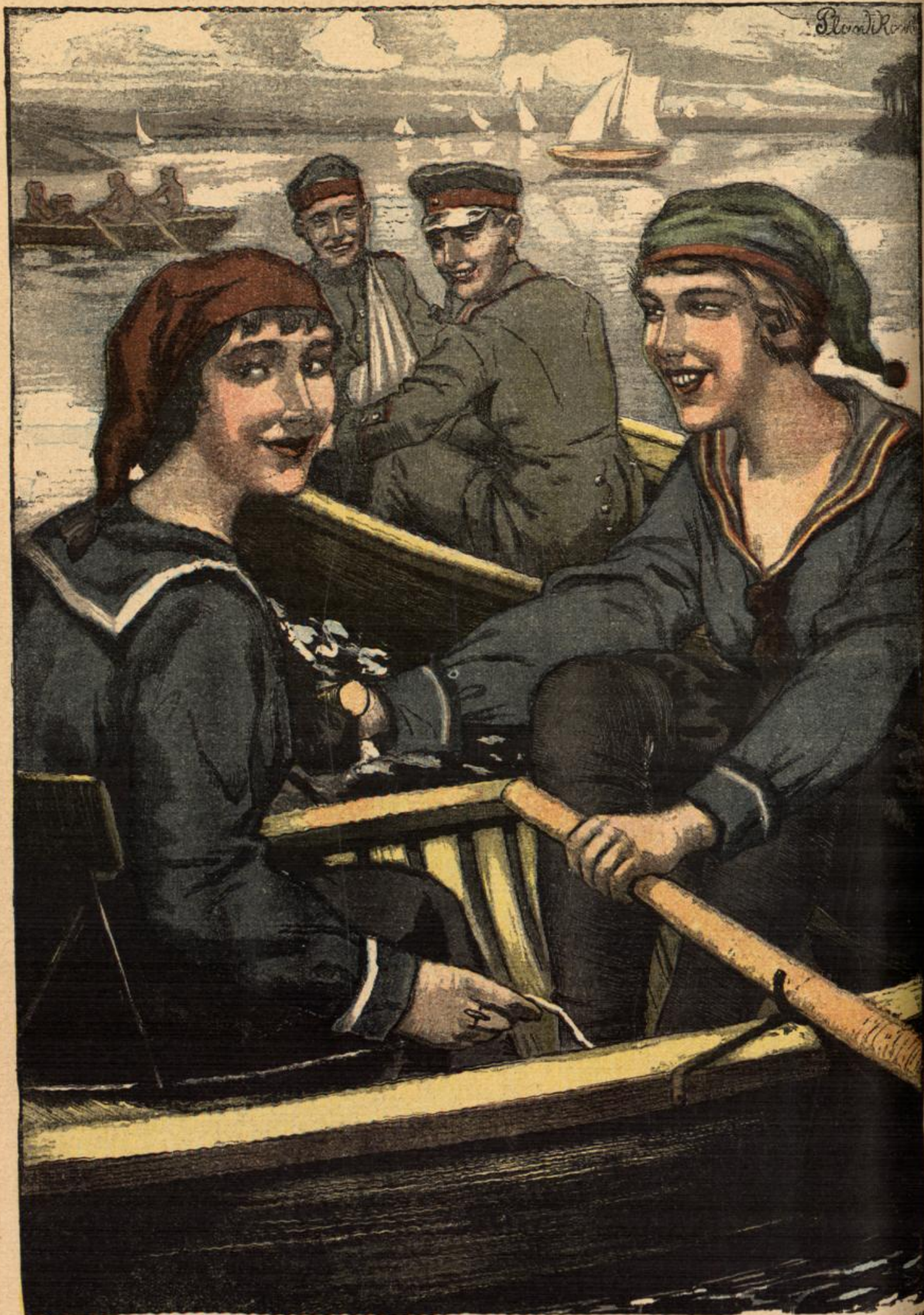
Auf dem „Kallauer“ See.

„Sieh nur, was die beiden Soldaten uns für Blicke zuwerfen!“ „Ja, eine richtige „Seh-schlacht“.“