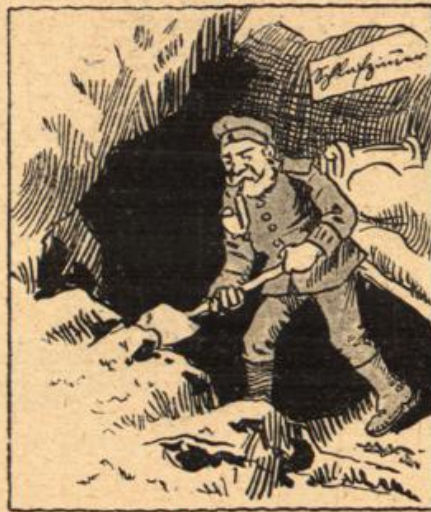
Man muß insgedessen schauen Noch ein paar Zimmer anzubauen.