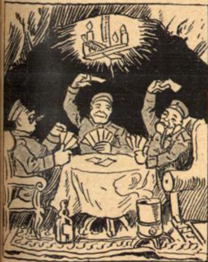
Dann geht's zum Stat, doch auf die Läng Wird schließlich das Quartier zu eng.