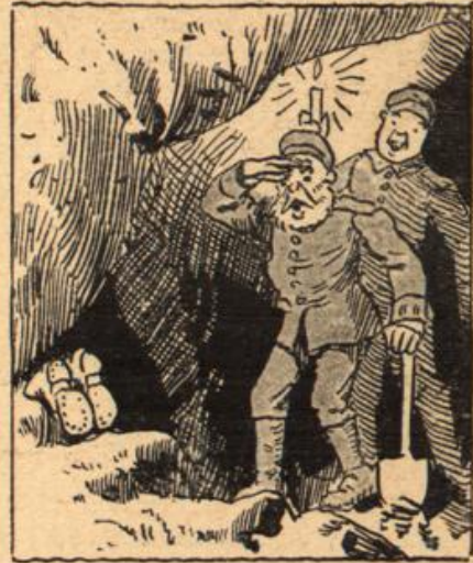
Bei dieser Tätigkeit nun war es, Als man entdeckt was Sonderbares,