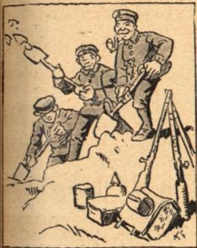
Der Vortrab macht im Walde Halt, „Eingraben!“ das Kommando schallt.