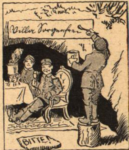
Worauf er dann in kurzer Frist Behaglich ausgestattet ist.