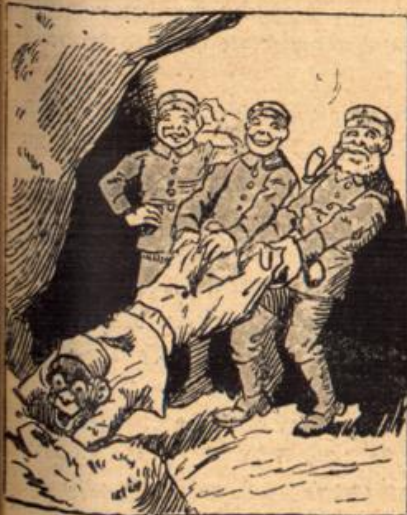
Was sich, als man hervor es puppt, Als richt'ger Turko dann entpuppt.