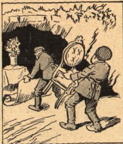
Der Nothbau ist schon aufgerichtet, Und auch an Möbeln fehlt es nicht.