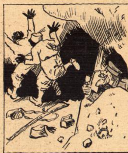
Denn die Erweiterungsbauten haben Geführt zum Feindes-Schlützengraben.