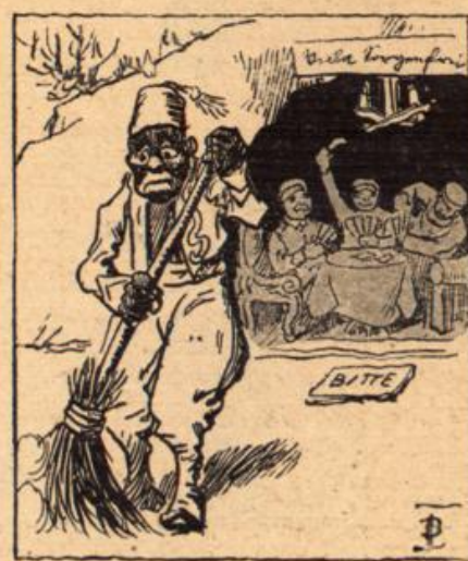
Der Turko aber vor der Hand Als schwarzer Hausknecht wird verwandt.