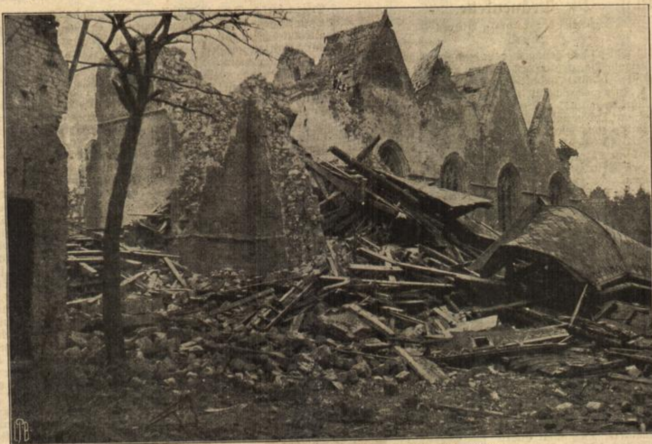
Die durch die feindliche Artillerie zerstörte Kirche von Bapaume.

Da öffnet sich die Tür. Ganz leise tritt der Geliebte an sie heran. Sein Antlitz, das sie eben noch so freudig glänzen sah, wird ernst und traurig bei ihrem Anblick.