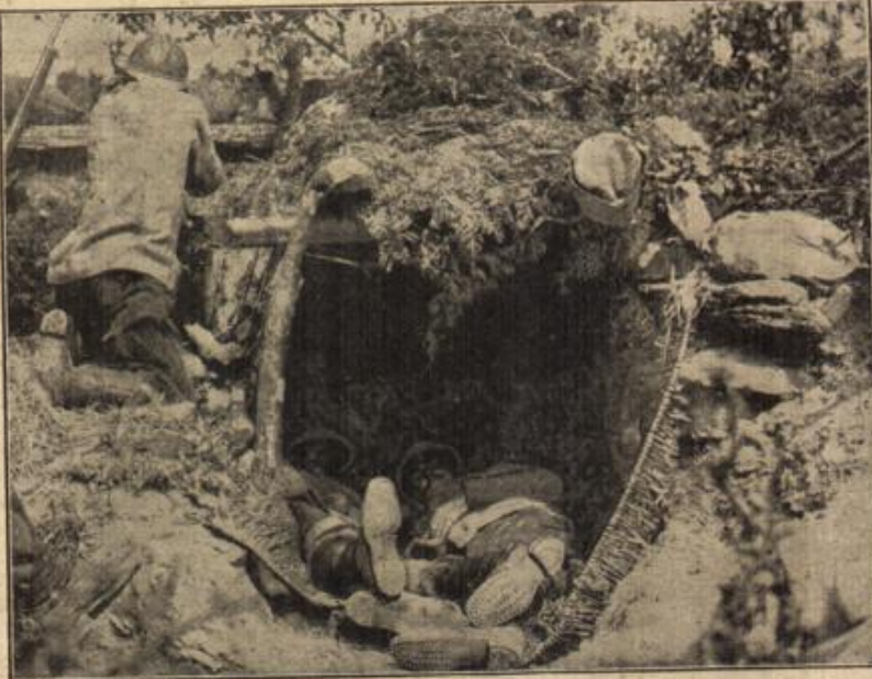
Die primitiven Schützengräben der serbischen Soldaten in Mazedonien. (Nach englischer Darstellung.)

Die Friedensglocken würden einmal läuten und Gottes Sonne würde über Deutschlands Blüten leuchten, daß die blutige Saat zu herrlicher Ernte reifte. Das hofften aller Herzen am heutigen Tage und darum herrschte eitel Fröhlichkeit in des alten Schlosses festlich geschmückten Hallen.