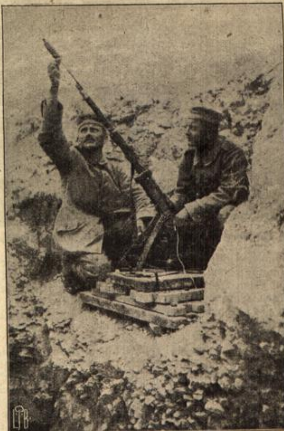
In die Wand eines deutschen Schützengrabens eingebaute Gewehrgranate beim Feuern.

Marmorbleich war des Edelfräuleins Gesicht. Ein Zug von Trost lag wohl noch um die fest zusammengepreßten, blutleeren Lippen, doch auch in Aftas stolzem Herzen regte sich die Reue.