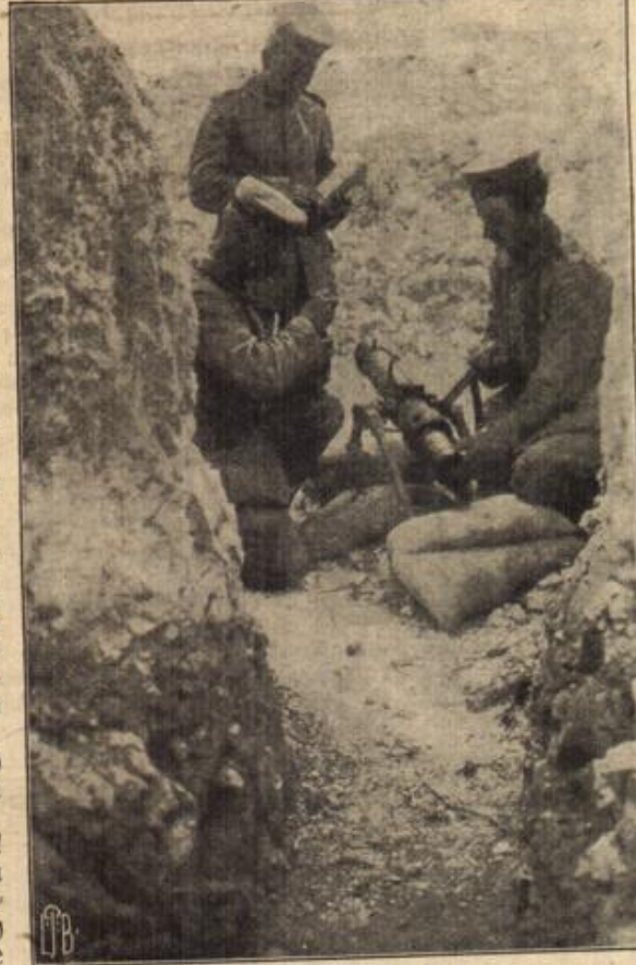
Aufstellung eines Minenwerfers in einer deutschen Zappe an der Westfront.

„Ich rauche selbst mit Leidenschaft, Don Alfonso, und kann deshalb Ihr Verlangen nachfühlen. Es ist Ihnen bewilligt.“