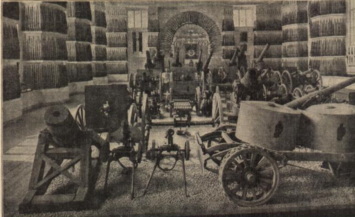
Die Beute- und Trophäenhalle in der Wiener Kriegsausstellung 1916. An den Wänden über 4000 russische Gewehre.