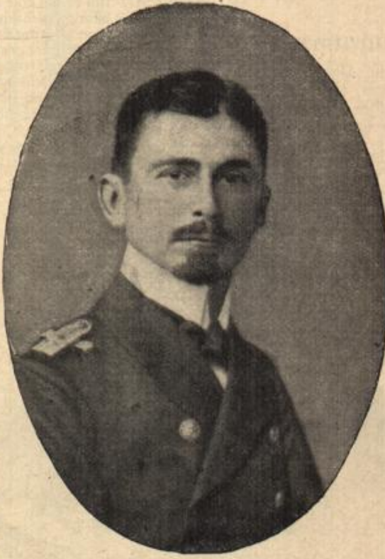
Kapitänleutnant Walter Forstmann, der Führer eines U-Bootes, mit welchem er über 100 feindliche Schiffe versenkte, erhielt den Orden „Pour le mérite“.

Doch sie konnte nicht handeln. Tagtäglich erhielt sie die Be-