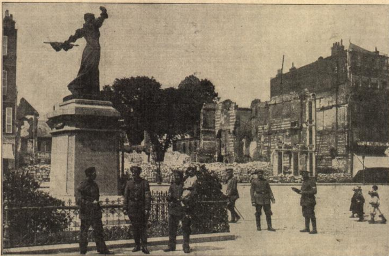
Marktplatz von Béronne mit zerstörten Häusern und dem Denkmal der heldenmütigen Jungfrau von Béronne.

Und Egon Brandeck, das Sonntagskind, glich dem Falter, der von Blume zu Blume sorglos und unbekümmert fliegt, da und dort ein bißchen nascht und sich dann fröhlich weitermacht. Ein großes Kind, erfreute er sich am Dufte aller Blumen, die an seinem Wege blühten, ohne daß aber dabei sein Herz in Mitleidenschaft gezogen wurde. Er flirtete und machte den Hof nach Herzenslust und allen Regeln der Kunst, es war ihm aber nicht ernst, es lag in seiner Natur, denn er liebte die Geselligkeit, frohe Unterhal- tung und ein lustiges, unbekümmertes Leben. Er liebte die Schön- heit und huldigte ihr, wo er sie traf. War aber klug genug, die Huldigungen niemals auf die Spitze zu treiben oder gar Herzen zu brechen. Dieser Ehrgeiz lag ihm fern, und schien ihm irgendwo Gefahr im Verzuge, sei es, daß er spürte, wie ein kleines, dummes