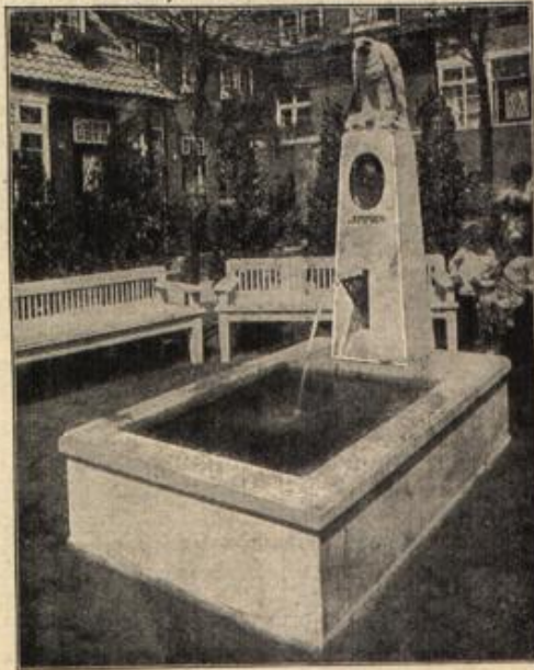
Der neue Emmichbrunnen in Hamburg.

Bälle, Kränzchen und kleinere Gesellschaftsabende wechselten in fast ununterbrochener Reihe ab, und auf allen den Unterhal-