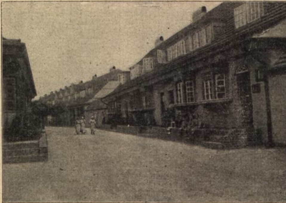
Die Stadt der Kleinen Leute: Straßen bei Spandau. (Mit Text.)