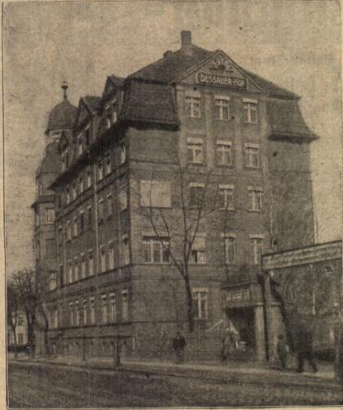
Ein historisches Haus Ostpreußens. (Mit Text.)

auf elf Uhr rückte, da wurde die alte Frau Murr ganz nervös vor Spannung und Erwartung. Sie eilte aus einem Zimmer in das andere, rückte da noch ein Deckchen, wusch dort noch ein Stäubchen ab und warf dabei immer wieder einen Blick aus