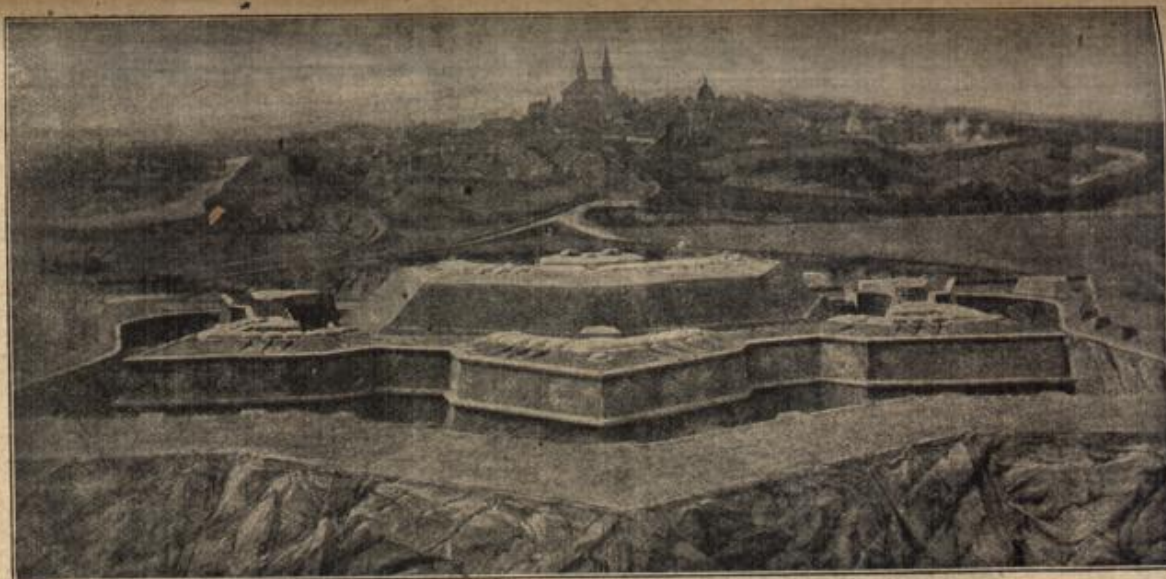
Die Befestigungswerke der Stadt Verdun.

Aus der Ausstellung „Die französische Festung und ihre Verteidigung“ in der Ausstellungshalle am Zoologischen Garten in Berlin.