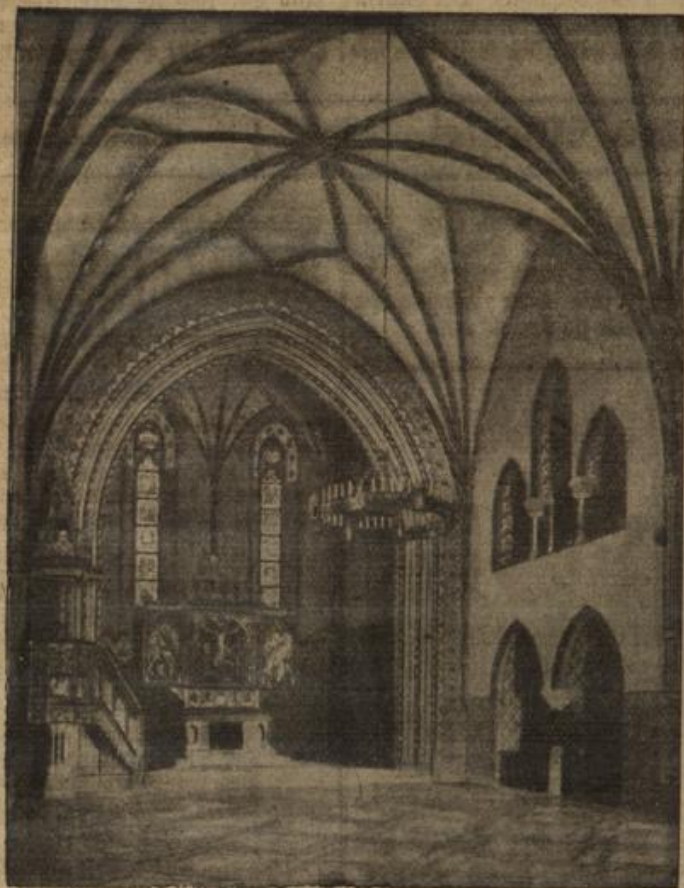
Blick auf den Altarraum der Kirche.

vide Lepsius. Wissen Sie noch? Damals; ehe der Krieg ausbrach — in Schandau." —