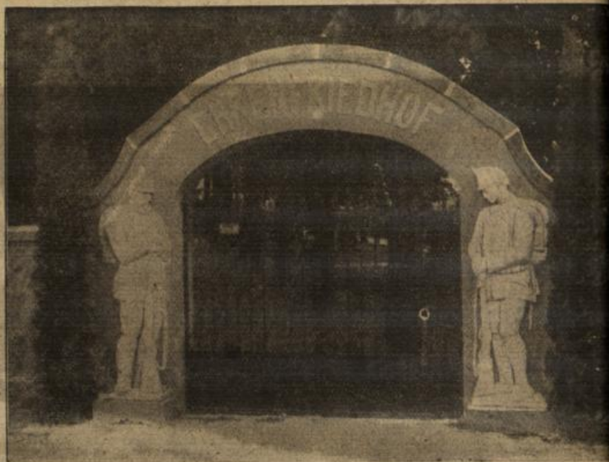
Der Ehrenfriedhof zu Enßheim (Wogesen).

Getröstet und gestärkt ging sie glaubte gefunden zu haben, was sie brünstig gesucht hatte; tiefer Frieden in ihr Herz gekommen, still und regen ihre Wünsche da wie gehorsam der, die der Mutter Lied zur Ruhe hat. Ihre Seele hatte sich dem Willen gebeugt, hatte demütig die