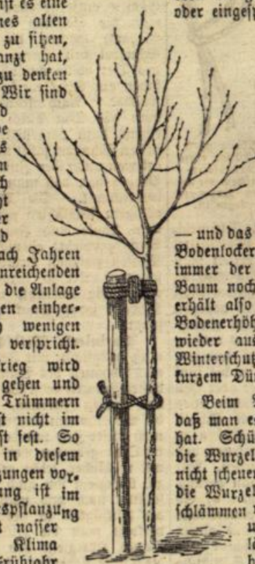
Abbildung 1. Richtige Länge des Baum- pfahles und schrägmaße Anbinden des Baumes.

Dennoch hat auch seine Schatten- seiten, ganz abgesehen davon, daß ein frei stehender Baum eher geneigt ist, sicher ver- ankernde Wurzeln zu bilden. Die Pfähle werden vor dem Pflanzen und bei Anlage von Baumlöchern vor dem Zu- schütten gesetzt und so verpaßt, daß sie kurz unterhalb der Krone enden (Abbildung 1), nicht in die Krone hineinragen (Abbildung 2). Bei Standorten in Waldnähe, wo größte