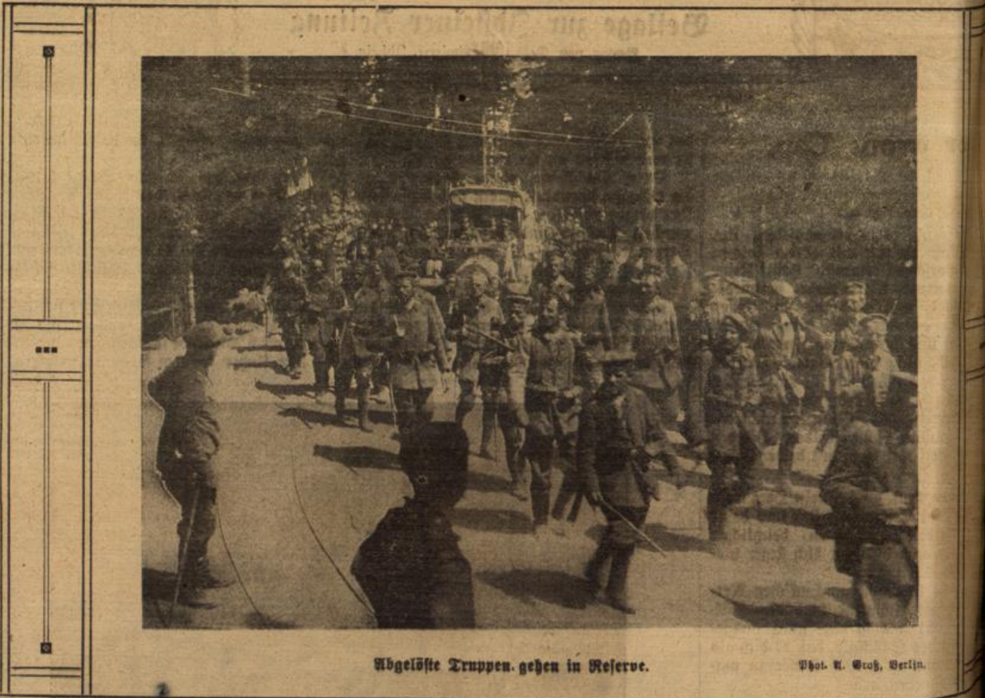
Abgelöste Truppen gehen in Reserve.

Kaum dämmerte der Morgen erhoben die beiden Schwestern brauchten viel Vorsicht bei ihrem hantieren, um niemand zu stören,