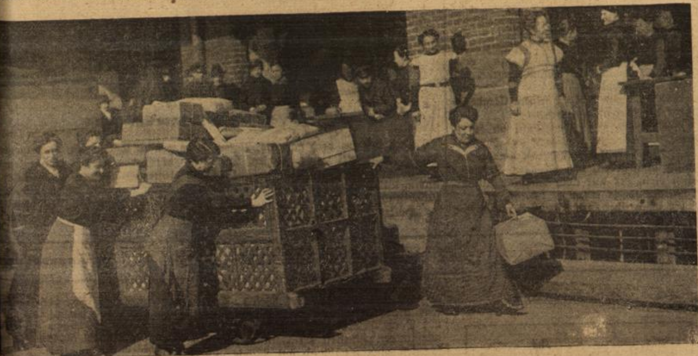
Weibliche Hilfskräfte im Paketpostamt.

Gret empfand mehr die versteckte Qual der Worte als ihren verletzenden Sinn. Sie war zu unschuldig dazu. Sie stand auf, trat an die Seite des Vaters und legte einen Arm um seine Schultern. „Eine Liebe hab' ich schon, Vati, und ein wenig heimlich ist sie auch. Als ich noch klein war, da war sie nicht so heimlich — aber auch nicht so stark und stolz.“ Ihr Blondkopf schmiegte sich an ihn. „Erträgst du es nicht, wer meine heimliche Liebe ist?“