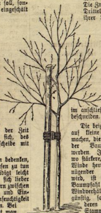
Abbildung 2. Ein zu langer Baumpfahl, die Aste säuern sich an dem Pfahle.