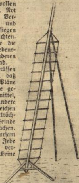
Abbildung 4. Einholm-Leiter.

Wir zu Hause müssen unsere Pflicht tun, daß die schändlichen Pläne unserer Feinde nie ge- lingen. Vieh, Futtermittel, Getreide und andere Lebensbedürfnisse reichen aus, um die niederträch- tigen Pläne unserer Feinde zuschanden zu machen. Aber wir müssen sorgsam und langsam sein. Jede Feuersgefahr muß ver- hütet werden. Keine Scheune, kein Stall, kein Vorrat irgend- welcher Art darf abbrennen. Kein Wald, kein