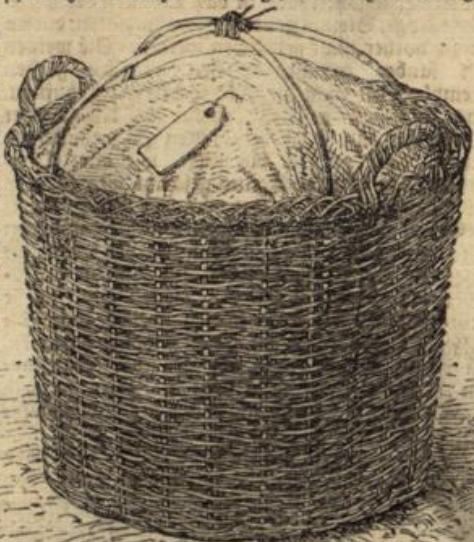
Abbildung 2. Weidenkorb für den Bahnversand.

In neuerer Zeit sind auch Einholml Leitern in den Handel gebracht worden, wie sie die Abbildung 4 vorführt. Bei richtiger Aufstellung gewähren sie eine hinreichende Sicherheit, sind leicht von Gewicht und bequem zu handhaben. Durch den Holm sind die Sprossen hindurch- geführt und an den Enden durch starken Draht befestigt. Die Fuhrhaken sind gleich stark wie der Holm, der seinerseits über die Sprossen erheblich hinausragt. An der oberen Sprosse sind zwei Stützen befestigt, die einzeln beweglich