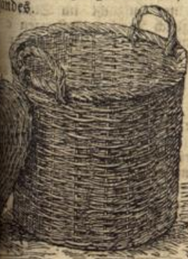
Weidenkorb für den Postversand.

Reinerters. (Mit 5 Abbildungen.) des Kernobstes hat begonnen. Noch im Zeichen des Krieges, und der nach wie vor: es darf nichts Was nicht nutzbringend an Ort und entweder frisch oder konserviert, kann, muß an andere Stellen wo daran Bedarf ist. Damit auf die Frage des Obstmarktes und.