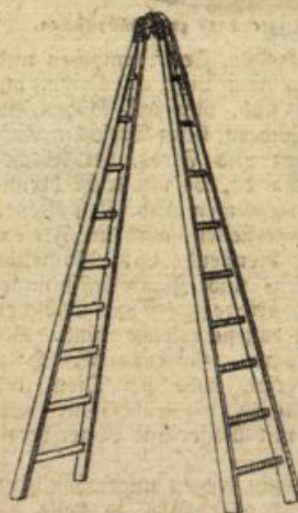
Abbildung 3. Verlegbare Doppelleiter.

sind und auch auf unebenem Gelände ein sicheres Auf- stellen gewährleisten.