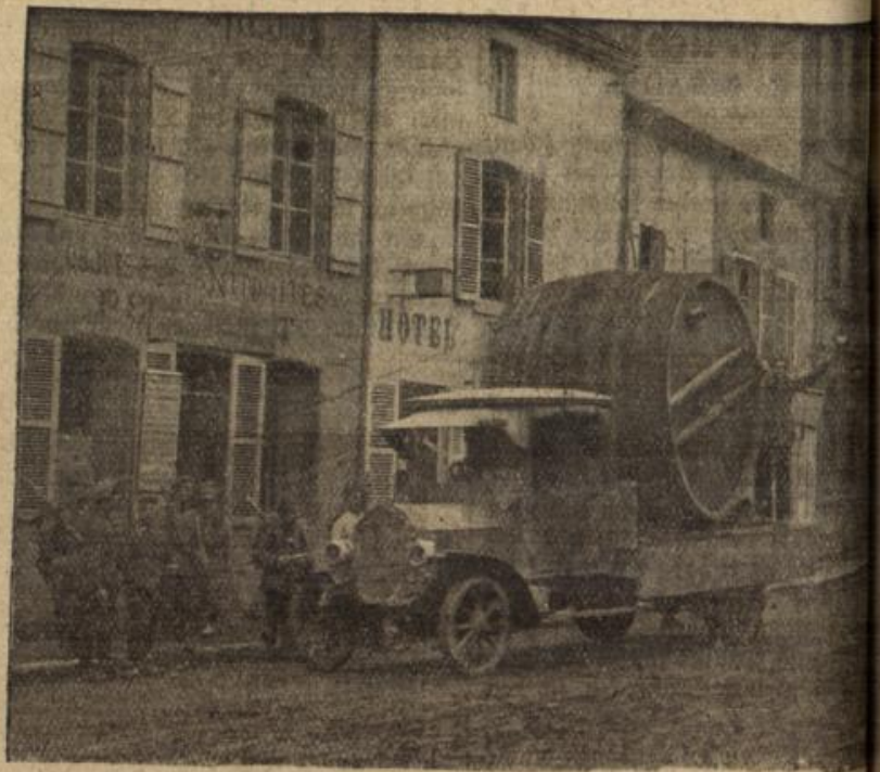
Fahrbare Desinfektionsanstalt auf der Straße in Vouziers.

Sie half ihr, niederzujagen voll Mitleid auf diese Gebrech-