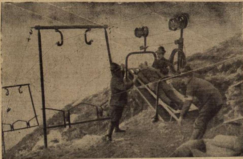
Italienischer Verwundetentransport im Hochgebirge vermittelt einer Drahtseilbahn.

Straßenlaternen Unfug trieb, war erwiesen; den Brand der uralten Linde auf dem Schloßberg aufzuklären, war noch der Zukunft vorbehalten, aber es gab Berufspaziergänger, die behaupteten, an jenem Nachmittage Asperg im Walde getroffen zu haben und einige schworen, sie hätten ihn hoch oben in der Linde sitzen sehen, die brennende Zigarette im Mund. — Und dann hatte die Stadt noch ein dunkles Geheimnis, von dem die Damen in den Kaffeekränzchen nur mit