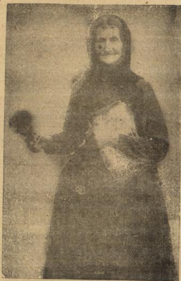
Ein weiblicher Gemeindediener in der fränkischen Ortschaft Groß-Eibstadt.

Am nächsten Morgen fuhr er in einem der jetzt spärlich rollenden Kraftwagen auf einem kleinen Umweg durch den Tiergarten nach der Budapesterstraße hinunter!