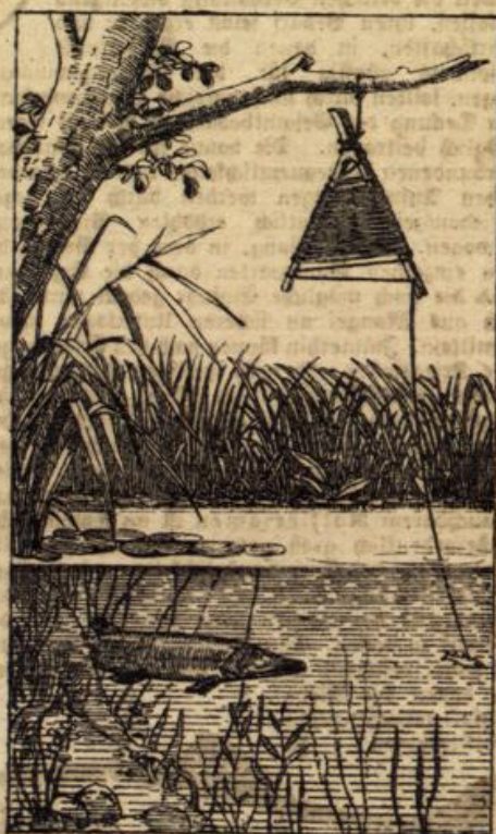
Abbildung 2. Stellangel.

welche der blanke Löffel nach rechts und links macht. Die Spinnangel kann man nur vom Kahn aus schleppen, daher nennt man sie auch Schleppangel. Die Schnur, woran der Spinner befestigt ist, muß stark sein, da man meist damit große Hechte fängt. Man sucht sich die Stellen auf, wo große Hechte stehen, das sieht man am Rand der selben, und spinnst daran