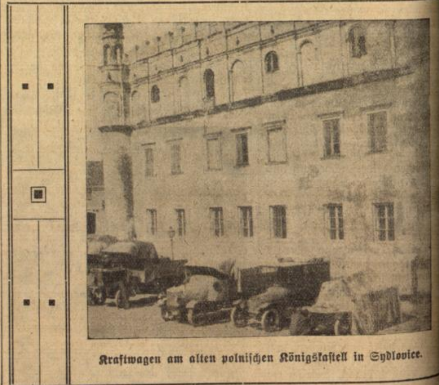
Kraftwagen am alten polnischen Königskastell in Sędzowice.

Und sie begriff langsam, die Krisis zum Bessern gewesen war auch ihm und ihr ein neuer Tag wollte.