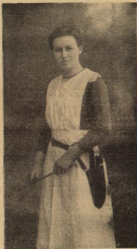
Der erste weibliche Fleischergeselle in Deutschland ist die Tochter des Fleischermeisters Max Kadner aus Pappendorf in Sachsen; bei ihrer kürzlich erfolgten Gesellenprüfung bestand das Gesellenstück im Schlachten eines Kalbes.

In einer Nacht glaubte sie, daß es mit dem starken Jungen zu Ende ginge! Die