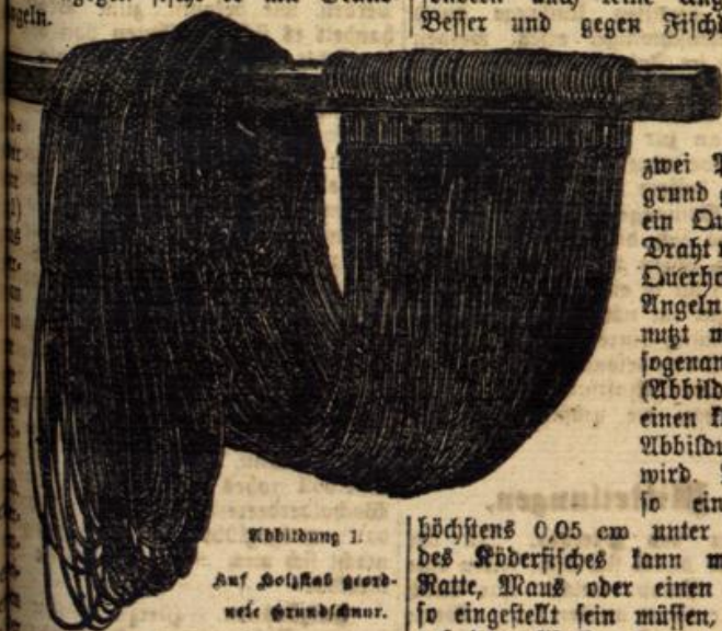
Abbildung 1. Auf Holzstab geord- nete Grundschnur.

Außer für den Fischereiberuf ist die Angelei für die Inhaber kleinerer Gewässer von großer Wichtigkeit. Die einmalige Kontrolle wie auch die Herstellung der Angel verursacht wenig Zeit und Kosten. Da sich die Angel überall, selbst in Teichen, anwenden läßt, wird sie dem Landmann auch dann, wenn sonst keine Fische zu haben sind, ein wohlthätendes Fischgericht verschaffen. Schließlich möchte ich noch darauf aufmerksam machen, daß die Angel penklichst