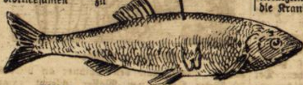
Abbildung 5. Befestigung des Aakens am Aderfisch.

werden, sollten davon Gebrauch machen. — Ganz ähnlich liegen die Verhältnisse beim Schwedenklee (Bastardklee, Alsite); auch hier wird der Bedarf bei weitem nicht gedeckt werden können, wenn nicht eine wesentliche Steigerung der Erzeugung eintritt. Weißklee und Gelbklee (Hopfenklee) sind im letzten Jahre nicht so knapp gewesen, wie die beiden erwähnten Arten. Eine angemessene Erweiterung der Samenwerbung wird aber auch hier erfolgen müssen, wenn der Bedarf ganz gedeckt werden soll. Der letztere ist gegenwärtig größer als zu normalen Zeiten, einmal deshalb, weil die in beträchtlichem Umfange ausgeführten Moos- und Obstands-kulturen weitere Mengen in Anspruch nehmen, und