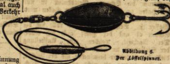
Abbildung 6. Der Löffelspinner.

bei mehrjährigen Klee- und Raigrassschlägen beide Grasarten bis zu einem gewissen Umfange durch Knaulgras und WiesenSchwingel ersetzt werden können, deren Samen im Inland in beträchtlichen Mengen gewonnen werden. Das überaus trockene Jahr 1915 hat einen höchst empfindlichen Mangel an Serradellafamen zur Folge gehabt. Die Zufuhren vom Auslande waren ganz unbedeutend. Da in diesem Jahre bessere Erträge in Aussicht stehen, sollte die Samengewinnung nirgends versäumt werden, wo sich die Möglichkeit dazu bietet. Ganz ähnlich liegen die Verhältnisse bei der Lupine, auch bei ihr ist eine außerordentliche Knappheit an Saatgut im nächsten Jahr zu erwarten. Die Gewinnung hinreichenden Samens für die Futterschläge ist von besonderer Bedeutung, weil wegen der fehlenden Kraftfuttereinfuhr dem einheimischen Futterbau die größte Beachtung zu schenken ist.