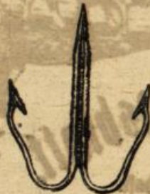
Abbildung 4. Salsungelhaken.