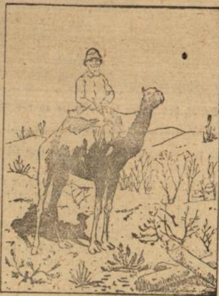
Wo ist der zweite Verrierstalter?

Wahrnehmung: Das Bild ist auf dem Kopf zu sehen, dann findet man oben auf dem Rücken des Reiteres den zweiten Verrierstalter.