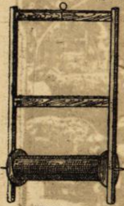
Abbildung 3. Siebangel mit Roste.

sauber gehalten werden muß. Die Haken müssen gepulzt und Schuur und Vorfach am besten in warmem Seifenwasser gewaschen werden. Alle sogenannten Fischwittungen haben sich in der Praxis nicht bewährt und füllen nur den Geldbeutel desjenigen, der sie verkauft.