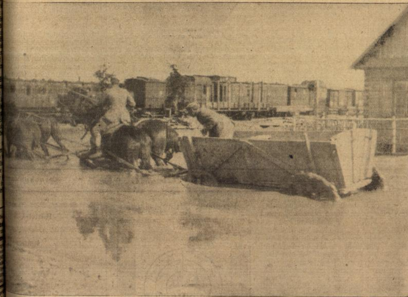
Auf Rußlands unergründlichen Wegen: Im Kampf mit dem Schlamm.

Es stimmte! Die Augen hatten sie ihm schon leise zgedrückt. Nur die Lippen standen noch ein wenig offen, als wollte der