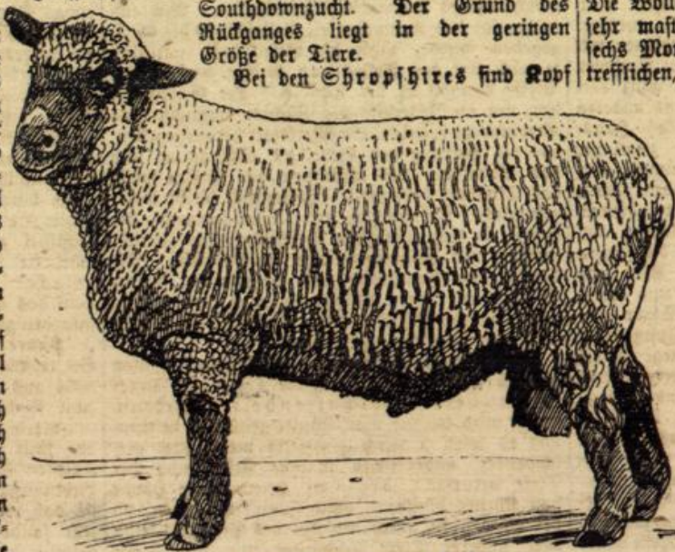
Figur 1. Hampshire-Down-Vod.

sich der und Beine von brauner bis graubrauner Farbe. Sie sind größer als die eben genannten Southdowns. Die Böcke erreichen ein Durch- schnittsgewicht von 100 kg, die Mutterschafe ein solches von 55 bis 60 kg. Die Mast- fähigkeit ist eine sehr gute. Am bekanntesten dürfte die Stammzucht des Domänenrates