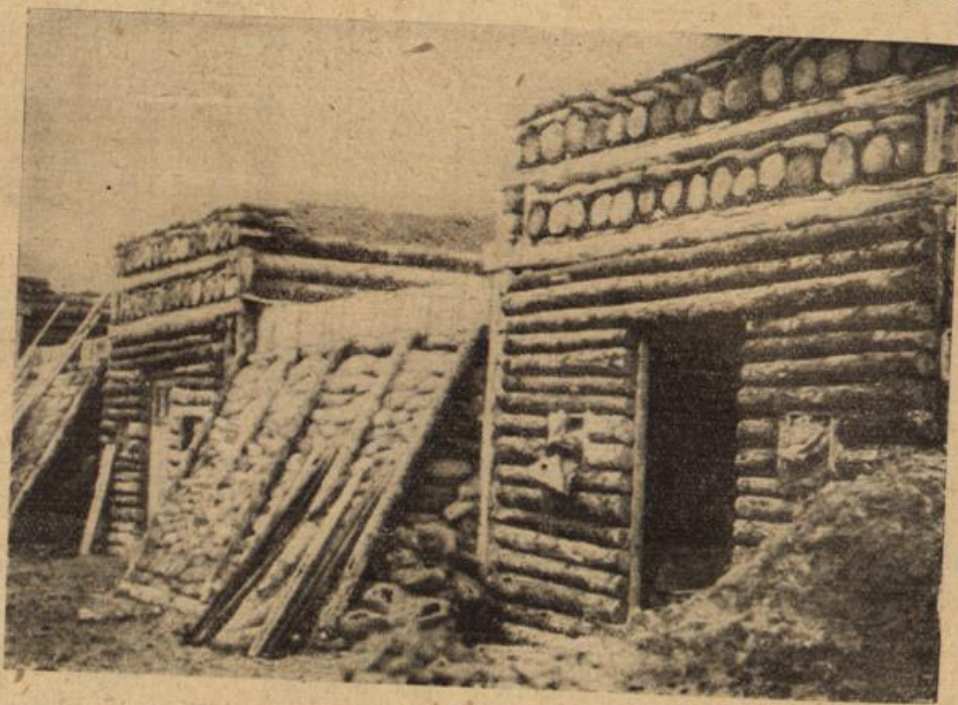
Aus Baumstämmen errichtete französische Artilleriestellungen.

So wurde das Unglück ihrer Ehe, das sich doch erst in diesem über sie entscheidenden Augenblick als ein solches herausgestellt hatte, auch fremden Augen offenbar. — Sie hatte sich niemals in dem stillen, schwerfälligen Ostpreußen, dessen herbe Schönheit dort — in der Gegend von Borzhymen, wo