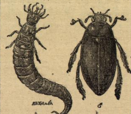
Schwarzer Goldwasserkäfer ( Hydrophilus piceus ). a) Larve. b) Käfer.

Der Käfer vermag nämlich unter Eis, wenn genügend Wasserzufluß vorhanden ist, den Winter zu überdauern. In Teichen und Tümpeln, die auswintern, erscheint als erster in der frisch-