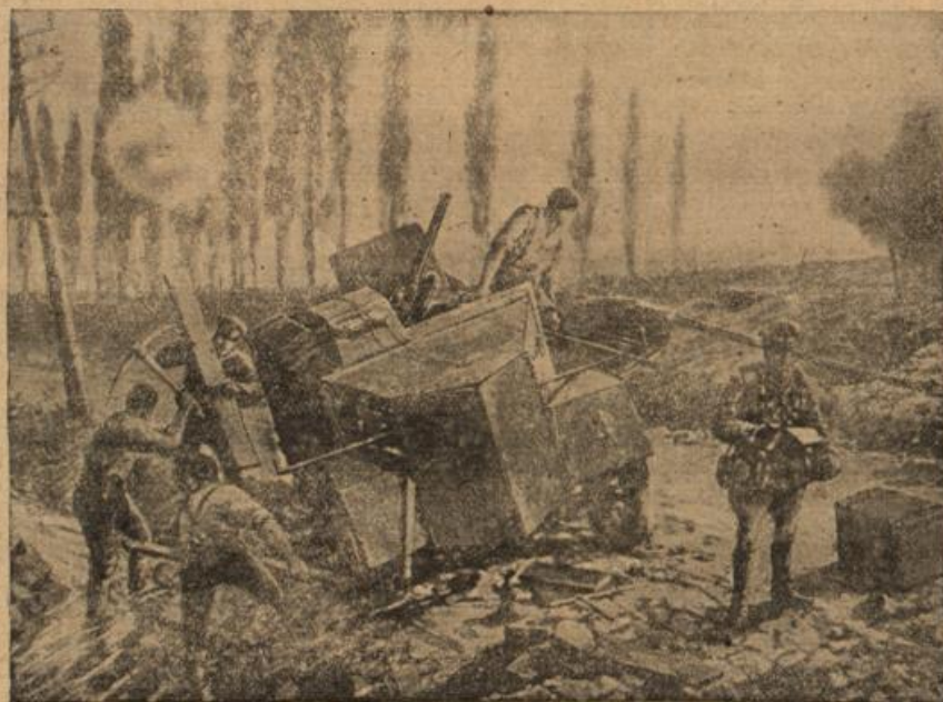
Im Moraste der franz. Landstraße stecdengebliebenes engl. Panzerauto.

die ärmer und bedürftiger als sie selbst