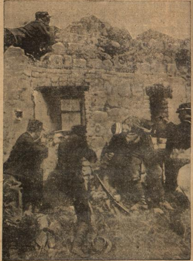
Französische Soldaten in einem Nahkampf bei Souhey.

Dieser Brief aber hatte das stolze Zukunftschloß mit seinen reichen Marmortreppen umgestürzt, sodaß nichts als eine Wolke von Mörtel und Staub in der Luft schwebte, welche auch vorübergehend den Blick des Empfängers verdunkelte. Kurz und klar schrieb sie ihm, daß sie endlich erkannt habe, warum auch er sie um-