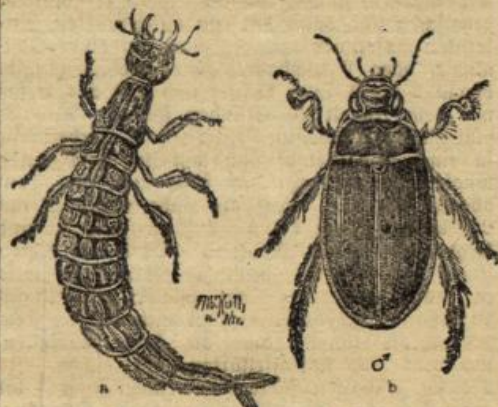
Gelbrand ( Dytiscus marginalis ). a) Larve. b) Käfer.

Rücken des Körpers, unter den gefurchten Flügel- decken befinden. Wenn der Käfer atmen will, stellt er sich im Wasser auf den Kopf, streckt das hintere Ende des Körpers aus dem Wasser heraus, biegt die Spitze nach der Unterseite