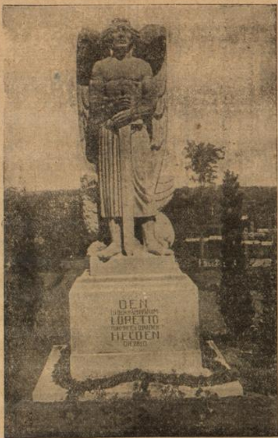
Das Loretta-Deulmal zu Veas in Frankreich.

waren, abgeben zu können. Einmal freilich fiel es ihr schwer auf das Herz, daß sie nun schon fast ein Vierteljahr von dem Bruder nichts gehört hatte. Aber dann vergaß sie es wieder.