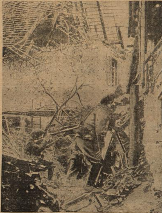
Französische Alpenjägerpatrouille in einem zerstörten Gehöft des Vogesengebietes.

schwärmte — — und, daß sie ihn achte — — tief und heiß.