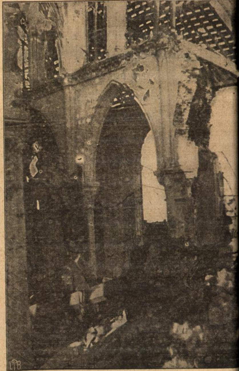
Ruinen der vollständig zerstörten Kirche von Bez Macquard b. Ville. Leipzig.

"Aber er ist krank Dina," warnte der Rittmeister mit bedenklichem Ausdruck ein, "kränker, fürchte ich, als ich ahnt. Das steife Bein ginge noch das Auge wird, wenn auch sehr ihm doch erhalten bleiben. Der schuß jedoch — ich weiß nicht —"