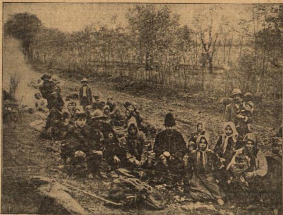
Serbische Flüchtlinge auf der Rasi.

Noch einmal zogen sonnenwarme, blaue Tage über Nordfriesland. Im bunten Herbstlaubkranz ihrer Baumgärten ragten auf den Warften die Höfe.