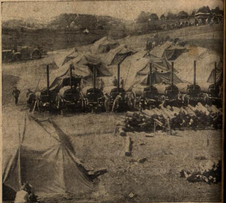
Feldlager einer Bäckerei-Kolonnie in den Karpathen.