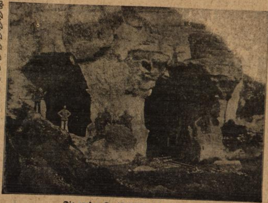
Die großen Sandsteinhöhlen bei Soissons.

„Sie müssen mutig sein,“ sagte er. „Erzwingen Sie sich mutige Gedanken. Sie müssen auch an meinen Tod mit Ruhe denken können. Ich bitte Sie darum. Sie helfen damit mein Schicksal gestalten. Unruhe und Besorgnis zieht das Unglück herbei. Wer sich vor einer Gefahr fürchtet, der ist ihr schon halb verfallen.“