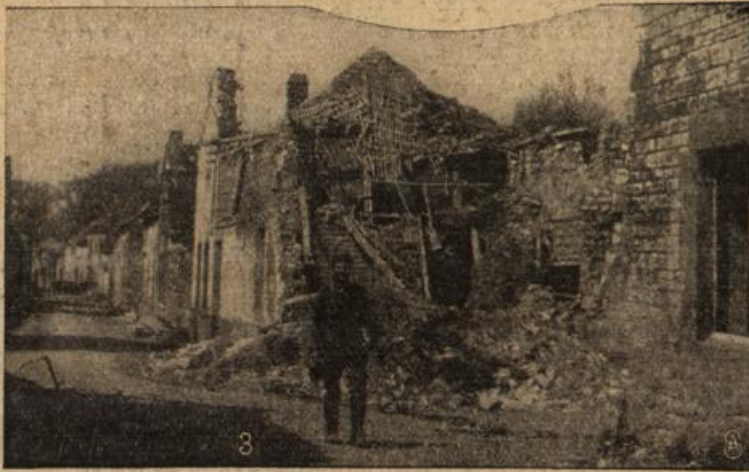
Am Fuß der vielgenannten Lorettohöhen.

Der Krieg im ganzen nimmt eine Er- die, solange es ung gibt, noch ist, so hat nisse mit sich in den Zeit- Welt noch nicht Dazu gehört lange Stellungen- nere Truppen gen die verbün- gen und Eng- den ihren Befolg- er und farbiger gen haben. Und den breiten Front de wieder die die Lorettohöhe, wie ein Ende llen. Immer uns in den amt- den die Lorettohöhe genannt, es unser erstes Bild aufge- den ist. Aus dem heißen die umwogte, schnitt der be- ststeller Bernhard Kellermann nungsvolle Szene heraus: höhe stand die oft genannte Notre Dame de Lorette. ein Haufen Trümmer. Hier er Quadratmeter Boden seine lt, seine Toten, sein Entsetzen. zerfetzt von Granaten. Hier der Weg und jede Besonder-