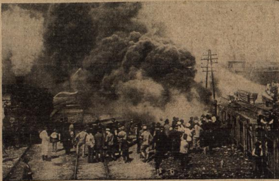
Bahnhofsbrand in Debreczin (Ung.)