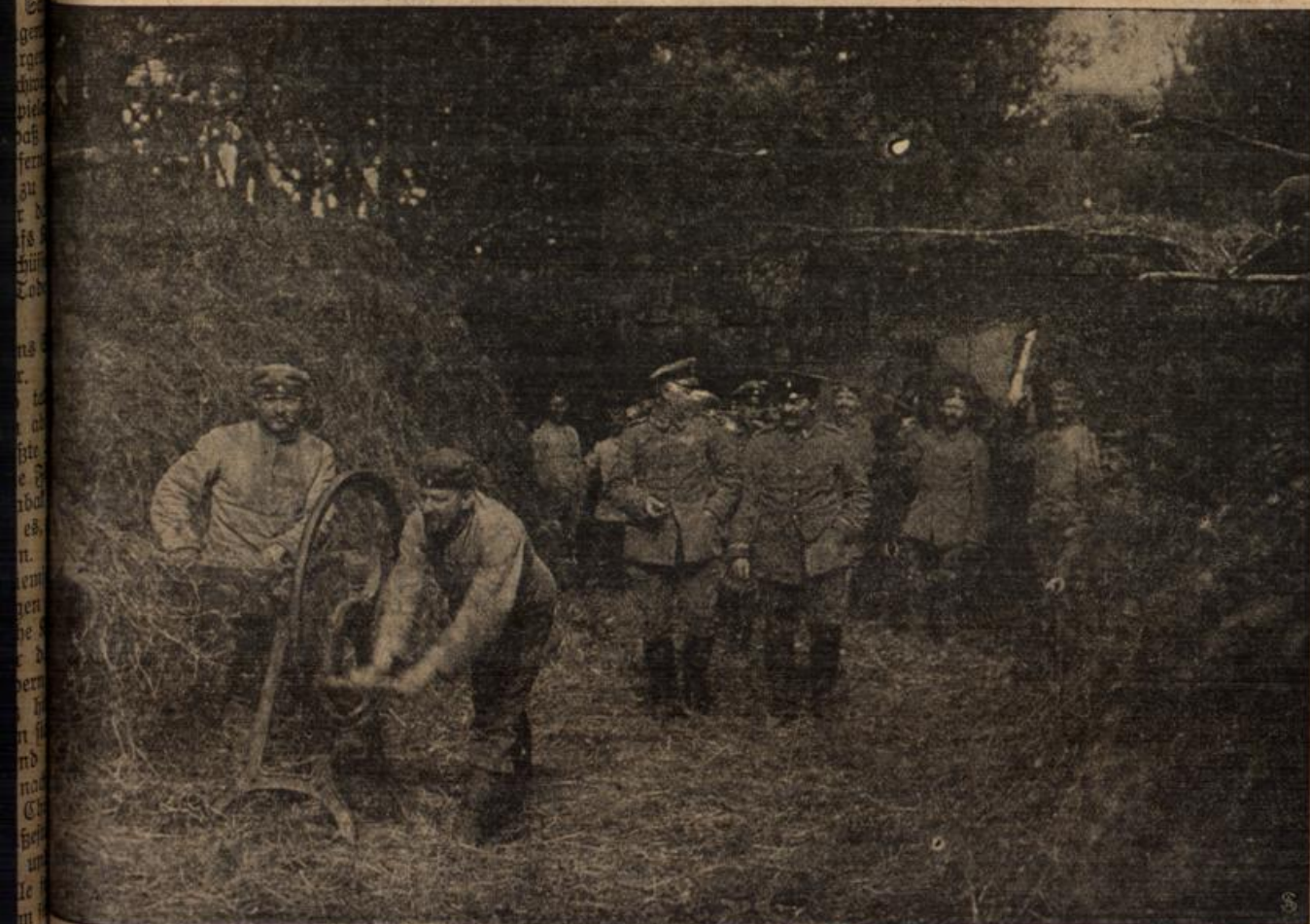
Ein Pferdestall dicht hinter der Front auf dem westlichen Kriegsschauplatz.

Pferd, trotz aller Erfindungen der modernen Technik für den Soldaten hat. Trotz Fahrrad und Auto wird es im Felde immer Gelegenheiten geben, wo man nur die willige Hilfe des gut behandelten, gut erzogenen, mutigen und kräftigen Pferdes sich nutzbar machen, wo man sich nur auf dieses verlassen kann. Dementsprechend ist natürlich auch die Pflege und Fürsorge, die man diesem edlen Tiere in diesem Kriege angedeihen läßt. Diese „zarte Sorgfalt“ läßt unser Bild eines Pferdestalles auf dem westlichen Kriegsschauplatz deutlich erkennen.