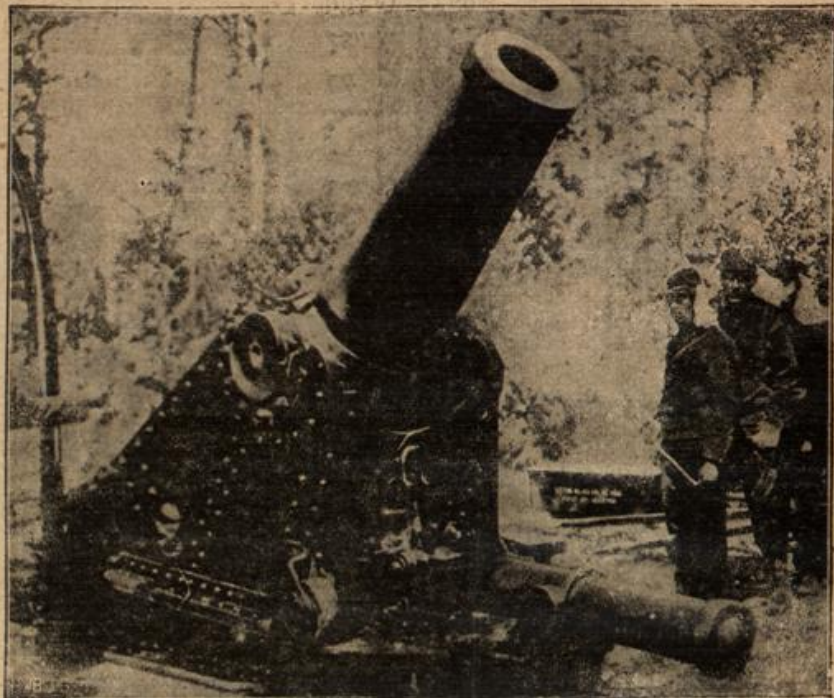
Das neue französische Belagerungsgeschütz. Unser Bild zeigt ein neues, eben aus den Konstruktionswerkstätten hervorgegangenes französisches Belagerungsgeschütz, mit dem die Franzosen ein Kriegsinstrument geschaffen haben wollen, das jetzt unsern Riesenmörsern, den „Brummern“ gewachsen sein soll.

Hans kam vom Dienst und traf unter seiner Wohnung den im ganzen Regim. beliebten, alten Heim, der so gern neben bei Geldgeschäfte machte. Hans grüßte ihn zuerst und lächelte freundlich, aber alte Herr nahm seinen vertrauten Zyl- der nur langsam von den weißen Haaren er hob ihn nicht sehr hoch, sein Au- blick fremd. Kurzum, Heim schien