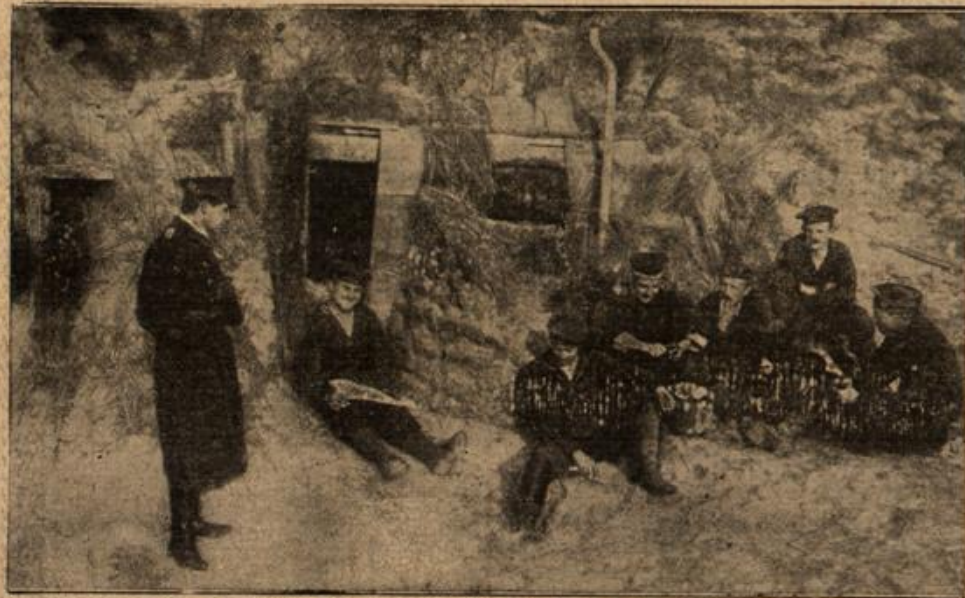
Vom westlichen Kriegsschauplatz: Moderne Höhlenbewohner.

„Ich weiß es nicht“, sagte sie unsicher. Die Herrin aber sah sie durchdringend an. Es hat doch keinen Zweck, daß Sie dies vor mir verhehlen. Mein Mann wird es mir doch sagen, wenn ich es haben will.“ Als sie diese Worte gesprochen hatte, errötete sie heiß, als werde sie sich bewußt, daß ihr damit eine Unwahrheit über die