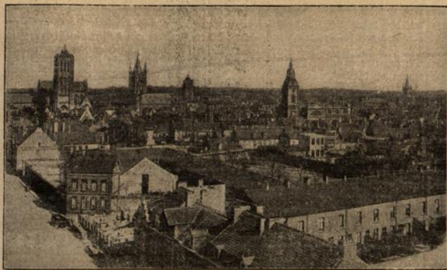
Oben: Der Schöffensaal im Rathaus von Ypern. Mitte: St. Martinskirche in Ypern. Unten: Gesamtansicht von Ypern

vernichtet, damit der Widerstand der Stadt auf immer gebrochen sei. Wer nicht getötet wurde, entfloh und suchte Rettung in Holland und England, um sich dort niederzulassen und das frühere Gewerbe wieder auszuüben. Unsere Bilder lassen deutlich erkennen, welche stolze bürgerliche Macht einst in Ypern thronte. Aus der Mitte der schon mehrfach erwähnten unvergleichlich schönen Tuchhalle, einem großen Hallenbau, erhebt sich der Belfried, das Wahrzeichen mittelalterlicher bürgerlicher Macht. (Auf unserem unteren Bilde der zweite Turm von links.) An der Ostseite ist im 16. Jahrhundert ein hübscher Renaissancebau, das Rathaus, angebaut worden. Aus dem 13. Jahrhundert stammt die gotische St. Martins-Kathedrale mit ihrer prachtvollen Fensterrose am Portal des südlichen Querschiffes. Der Turm ist später angebaut; er stammt aus dem 15. Jahrhundert. Bei der Menschenleere der Straßen und der auffallenden Ruhe, die über der Stadt lagert, wirkt Ypern wie ein Bild aus vergangenen Tagen.